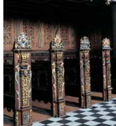
Dekorationerne i Slotskirken