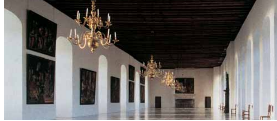
'Dancesalen', også kaldet 'Riddersalen'

I 1785 indrettede militæret Kronborg til kaserne og flere rum blev ombygget. Militæret forlod Kronborg i 1923, hvorefter slottet blev restaureret og genopbygget som i Frederik II og Christian IV's dage.