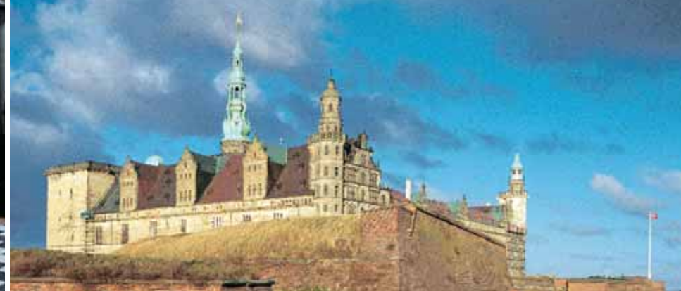
Kronborg med volde, set fra sydøst