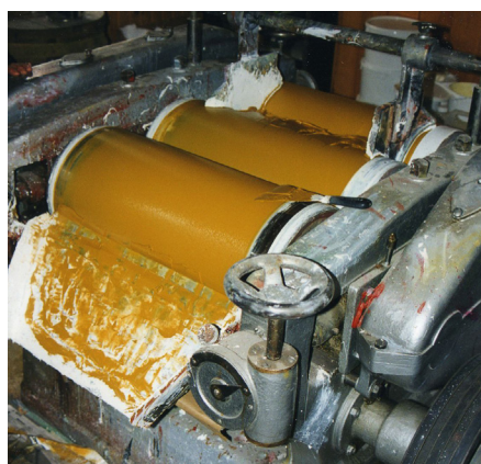
Rivning af guldokkerfarvet linoliemaling på en trevalse. Rivning på trevalse forbedrer linoliemalingens kvalitet, da alle luftbobler i pigmenterne rives ud.

er en jordfarve, der i nuance kan svinge fra lys gul med brunligt skær til mørkere, rødbrun farve. Farven er af meget gammel oprindelse. Sælges under navne som: lys okker, guldokker, pariserokker, mørk okker, alt efter farve og lokalitet. Pigmenterne er lysægte, ugiftige og anvendelige i enhver teknik. Dækevnen og farvekraften veksler fra art til art.