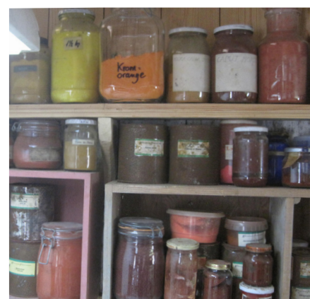
Røde pigmenter. Pigmenterne kan med fordel opbevares i glas, så man kan se farverne uden at åbne dåserne.

Blyholdig kraftig orangerødt mineralsk pigment. Kunstig fremstillet siden oldtiden. Anvendt såvel i ren tilstand som iblandet andre røde farver bl.a. cinnober for at strække den dyre cinnober og opnå en livligere kulør. Blymønje har god dækevne og farvekraft. Har primært været anvendt som olie og alkydharve. Farven er giftig og har