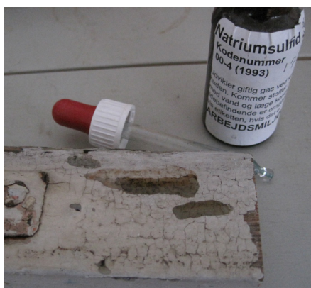
Test af forekomsten af blyhvidt med natriumsulfid. Væsken farves sort, og testen lugter kraftigt af svovl. Bemærk også slangeskindskrakeleringen, der er typisk for blymønje. Zinkhvidt har lidt større og aflange flager.