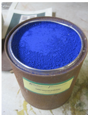
Ultramarinblå – et meget smuk og kraftig blå pigment.