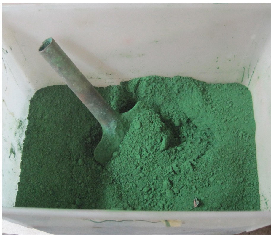
Kromoxidgrøn er et kromholdigt pigment med en matgrøn farvetone. Det blev i lighed med andre kromfarver første gang fremstillet i 1809, men blev først almindelig anvendt som malerfarve omkring midten af 1800-tallet. Farven er lysægte, ikke giftig og kan anvendes i enhver malerteknik. Farvekraft og dækevne er god.

Metoden var den såkaldte ”fældning”, hvor der dannes et bundfald, når to eller flere bestemte kemiske væsker blandes sammen. Bundfaldet tørres, renses og knuses til pigmenter. Man fandt som bekendt ikke guld, men de nye pigmenter kunne sælges for ”guld” og var derfor temmeligt kostbare. Af samme grund brugtes de udelukkende til kunstmalerier og dekorationsmalerier.