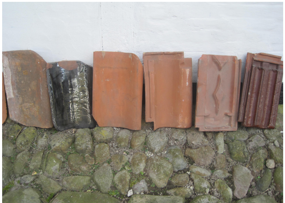
Nyere tagstenstyper: Fra venstre: håndstrøget tagsten fra midten af 1700-tallet (stadig intakt), sortglaseret tagsten, stringpresset maskintagsten fra 2000, falstagsten fra 1950'erne, falstagsten med rhombemotiv fra 1850'erne og rødglaseret falstagsten fra 1950'erne.

Med moderne produkter og oplægningsmetoder kan man vanskeligt