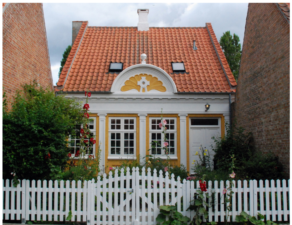
Smukt opskalet og inddækket tegltag, som der heldigvis er mange af overalt på ældre danske bygninger – her i Årskøbing.

Murerfaget findes der yderligere beskrivelser og rådgivning om tegltage. www.mur-tag.dk/