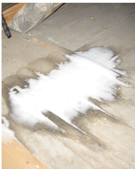
Vintermånederne – eller i øsregnvejr – er et godt tidspunkt at besigtige tegltaget på. Er der våde pletter på gulvet, eller ligger der ligefrem en drive med fygesne, er det tid for at få tætnet og under- strøget tegltaget.

For at tætte tagene mod fygesne og meget stærk slagregn skal stenenes samlinger lukkes med mørtel. Er den påført indefra, siges taget at være un- derstrøget, og hvor dette ikke kan lade sig gøre, er det forskellet udefra. Vedligeholdelse af understrygning og forskelling er vigtig og skal udføres med 3-5 års mellemrum.