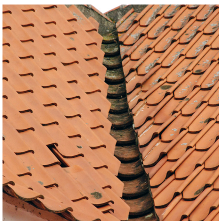
Hvis taget er forsynet med et fast undertag af brædder og pap kan man med fordel udføre skotrenderne med tegl i bunden. Det harmonerer smukt med taget i øvrigt og repræsenterer en gammel tradition.