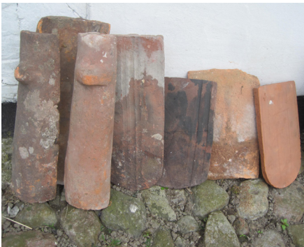
Historiske tagstenstyper. Fra venstre: Munke-nonnetagsten i den særlige danske udgave til de meget stejle nordiske tage, bæverhaler i forskellige størrelser.