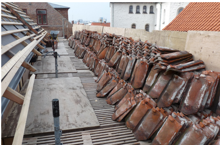
Tag lægges med genbrugssten. De gamle tagsten kontrolleres for fejl og revner, de dårlige kasseres og de gode lægges forsigtigt i stabler på stilladset.

Gamle tage er ofte skæve, bl.a. fordi bygningerne er det. Skævheder ved gavle og lignende har kunnet udlignes med skæve løb (lodrette rækker), som ikke går vinkelret på rygning og tagfod (tagets nederste kant). Falstagsten og moderne vingesten er formet til at følge et retvinklet system og kan derfor ikke optage skævheder fra bygningen og i taget. Den gamle, traditionelle oplægningss metode, hvor stenene bindes sammen med mørtel, stiller også mindre krav til tagkonstruktionens nøjagtighed.