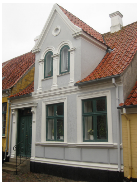
Smukt opskalket og inddækket tegltag, som der heldigvis er mange af overalt på ældre danske bygninger – her i Årskøbing.

Når man lægger et ordentligt tegltag, lægger man ikke halve sten. Normal lægtegang (afstanden mellem lægterne) fastlægges derfor, så tagfladen går op med hele sten, og sådan, at lægteafstanden passer til teglstenene, når de er oplagt med absolut korrekt dækbredde og nogenlunde tæt sammenlægning med størst muligt overlæg i løbene.