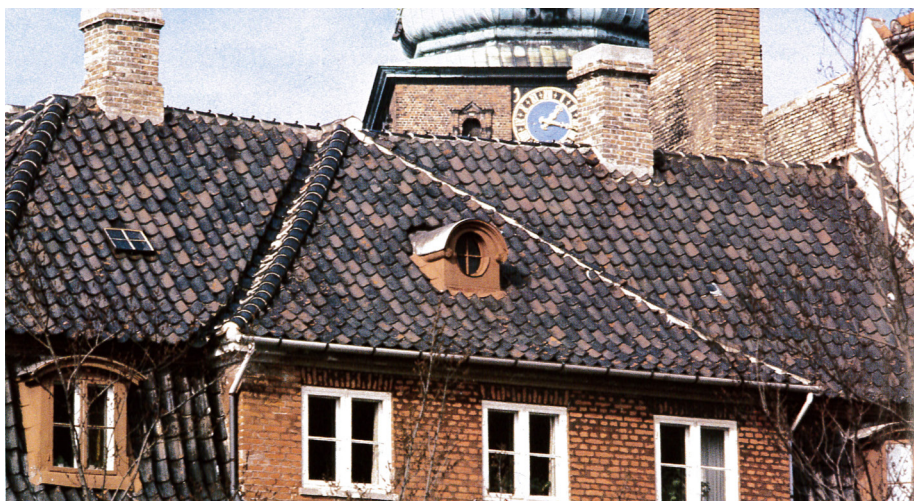
Rygninger og grater på tegltage skal lægges i mørtel, og skorstenspiber bør også indmures med mørtel som her, og ikke inddækkes med zink eller lignende.