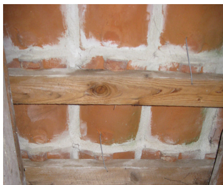
Ved understrygning og forskelling skal der ikke bruges mere mørtel end nødvendigt for tætning og ved- hæftning - det giver det pæneste udseende. Man skal også passe på, at understrygningsmørtel ikke bliver synlig udefra, fordi den derved kommer så tæt på teglstenenes løb, at den kan opsuge vand, der kan føre til frostsprængninger.