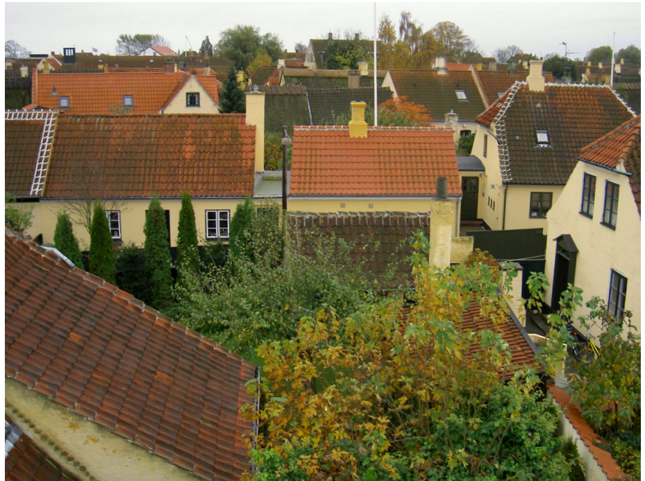
Udsigt over dansk provinsby med tegltage, skorstene med indmurede inddækninger og enkelte steder hvidkalkede forskellinger langs gavlene og tagryggen.

Omkring 1550 kommer vingetagstenen til landet og bliver helt dominerende frem til slutningen af 1900-årene, hvor der bringes falstagsten af mange forskellige typer på markedet.