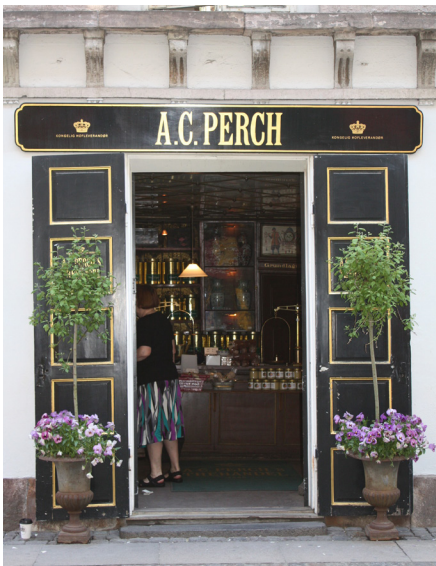
Enkelt malet skilt, der er fint og indpasset i facadens arkitektur.