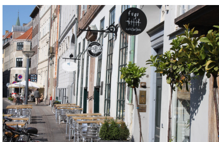
Udhængsskilte svækker sjældent facadens arkitektoniske udtryk og er derfor velegnede til ældre bygninger og bymiljøer.

Vandrette facadeskilte bør som udgangspunkt være i samklang med facadeopdelingen. Sidder de over vinduerne, bør de passe med vinduesbredden, og spænder de over flere fag, bør skiltebredden afpasses efter facadens lodrette delinger. Dette gælder, hvad enten der er tale om egentlige skiltelementer med tekst på, eller bogstaver sat op direkte på murfladen.