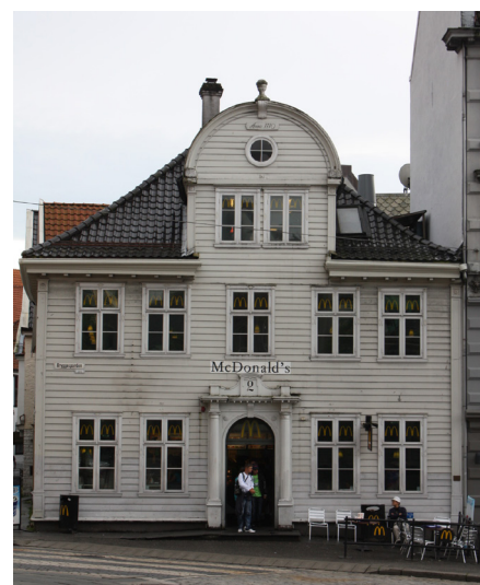
Hvis man vil sælge burgere i Bergen, hvor de fleste turister kommer for at opleve den særlige træarkitektur, er det en god idé at skrue lidt ned for den kendte gule "M" og plastikkiltene, hvis man vil være gode venner med kunderne.

I mange fredede og bevaringsværdige bygninger og bymiljøer vil lysende reklameskilte være for dominerende, her vil den bedste løsning ofte være en belysning af almindelige skilte. Lysskiltet udformet som kasser virker som regel altid skæmmende. Ønsker man lysende skilte, kan det gøres på to måder: