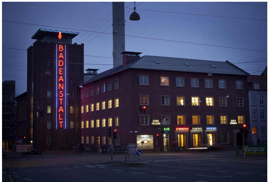
I mange tilfælde er skiltningen en del af bygningens fredningsværdier, som f.eks. Badeanstalten Spanien i Aarhus, opført 1930-31 fredet 1989, med nogle af de første neonskilte i Danmark.

Med industrialismen kom der nye måder at skilte på, hvilket særligt kom til at præge de nye byudviklingsområder, brokvartererne og stationsbyerne. Her skilte man med store skilte i emalje og glas og med bemalinger direkte på facaden eller på gavlene, der blev prydet med store reklamemalerier. Denne