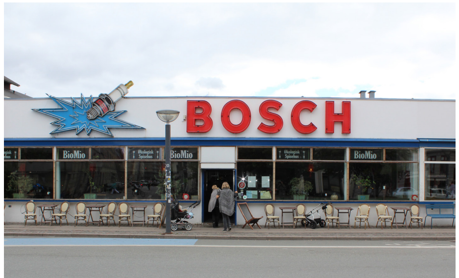
Det store Boschskilt er en del af bygningens fredningsværdier. Selvom der i dag er en helt anden funktion i bygningen, er det gamle skilt et aktiv for restauranten, der henvender sig til den kundegruppe, som tiltrækkes af den særlige atmosfære i "Den Hvide Kødby".