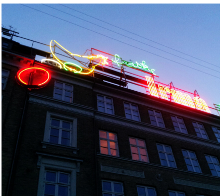
IRMA hønen fra 1953 har næsten fået kultagtig status.

Facadebelysning er først blevet aktuel i nyere tid. Førhen færdedes borgerne ikke så meget ude efter mørkets frembrud. Først da etableringen af offentlig gadebelysning og bedre gadebelægning gjorde det muligt at promenerere om aftenen - ja, selv gøre indkøb, opstod behovet for, at også gadens forretninger og især deres vareudstillinger blev belyst. Det var dog først efter elektricitetens almindelige udbredelse, at det blev muligt at holde en butiksbelysning i gang natten igennem.