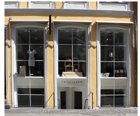
De elegante, præcise og tynde jernsprosser klæder denne butiksfacade virkelig fint – og virker langt mere raffineret end hele ruder. Det er derfor perfekt, at ruderne kan isoleres meget effektivt indefra med hele energitermoruder, uden sprosser, samtidigt med at det fine arkitektoniske udtryk bevares fuldt ud. Bemærk også de meget diskrete markiser i opklappet form.

Butiksdøre bør ikke udføres med udvendige beklædninger af for eksempel panelbrædder, aluminiumsplader