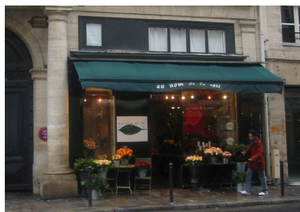
Her passer den meget enkle og beskedne markise både til de øvrige farver i husets underfacade, bl.a. porten og nabobutikken, og så passer den endvidere farvemæssigt til butikkens navn og indhold, 'au nom de la rose'. Vi er med andre ord i Paris hos en filmglad butiksejer. Skiltningen er også ganske diskret og pæn, anbragt på kanten af markisen.

Snarere end at vælge den slags bør man holde fast ved den enkelthed i formen, der kendetegnede de oprindelige markiser. Det vil klæde den bevaringsværdige facade bedst.