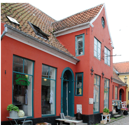
Ud over at passe ind i gadens farvemæssige helhed, kan butikkens og facadens farvevalg også samtidigt afspejle forretningens identitet – her en knaldrød (engelskrød) isenkræmmerbutik, der gerne må være lidt festlig, og en mere alvorlig og kølig grå ejendomshandel.

byggetekniske problemer. I mange tilfælde passer den nye dragt slet ikke til huset, der enten kan gøre facaden for glat og slikket eller for rustik.