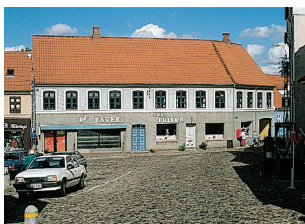
På Torvet i Mariager har denne forretningsjendom for nogle år siden fået facaden kraftigt forskønnet. Selv med en mere stilfærdig skiltning og mindre vindueshuller sælger bagerforretningen næppe færre franskbrød i dag end før denne ombygning.

har også været, at den enkelte forretning skulle skille sig så kraftigt ud fra mængden som muligt.