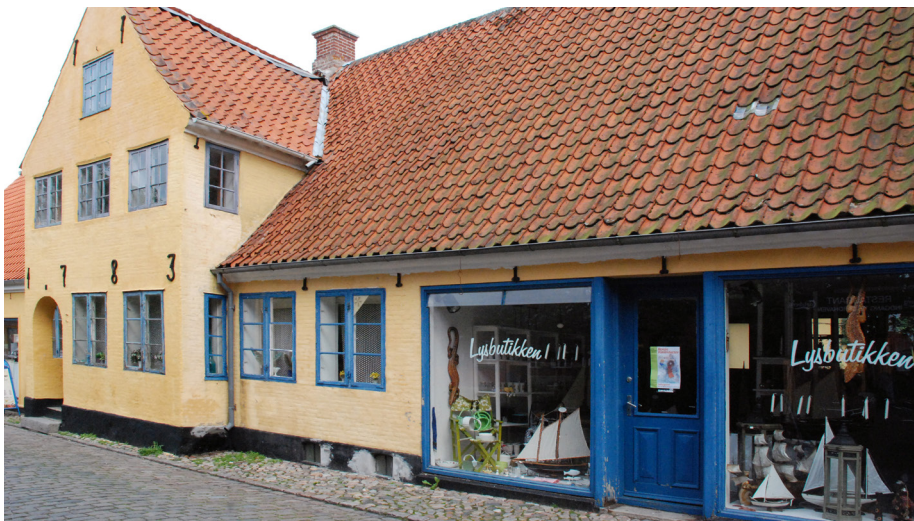
En kalkning er totalt mat, hvilket får sollyset – og lyset i det hele taget, til at spille smukt i overfladens kalkkrystaller, så facaden herved fremstår meget klar og elegant med en lysende glans.

Et par tommelfingerregler for, hvad der indgår i gode løsninger, er: