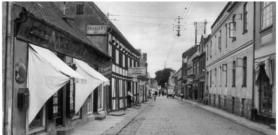
Foto fra midten af 1920'erne i Adelgade i Nysted. De solafskærmende markiser, der skulle modvirke solblegningen af bøgerne i Nystred Boghandel, var ikke så standardiserede som i dag, men dog alligevel mulige at klappe ud og ind, som på modsatte side af gaden, efter behov.

Der findes i dag et væld af forskellige permanente og mobile markiser. En stor del af dem er udført i materialer, der er fremmede for gamle huse - f.eks. blank plastik- eller nylon-dug. Ydermere er farverne ofte skrigende i forhold til traditionelle facadefarver, og markiserne kan have faconer med tunger, frynser eller lignende.