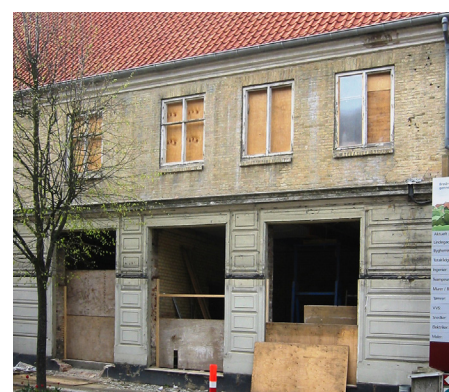
Endnu et eksempel på før og efter. Forretningsejendommen Spielweg & Co i Christiansfeld. Inde bag den voldsomme forretningsfacade, der helt skar huset helt over vandret, fandt man spor efter en tidligere, faktisk ret smuk, harmonisk og flot håndværkermæssig detaljeret forretningsfront. Denne stammer formentlig fra en større ombygning og udbygning af huset i 1856.

Huset er i øvrigt interessant i forhold til butikernes kulturhistorie i Danmark. Det er opført i 1778 og fra starten indrettet til 'handelshus', hvilket skyldes Christiansfeld's særlige købstadsmæssige status, der muliggjorde handel udenfor torvepladsen. Den viste forretningsfacade er næppe fra 1778, men fra 1856, idet vinduesoverkanterne er båret af indmurede jernprofiler.