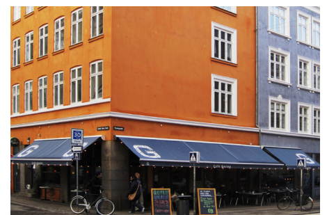
København kan nu også. Smuk overensstemmelse mellem markiser og husfacadernes lyse kalkfarver – både tilpasset og som kontrast. Enkel og afdæmpet skiltning. De kulørte lamper er kun opsat i anledning af julen.

I mange af de historiske bykerner nedlægges der i disse år den ene gamle butik efter den anden. Det er oplagt at indrette eller 'genindrette' disse til almindelig beboelse igen. Her har man 3 forskellige muligheder.