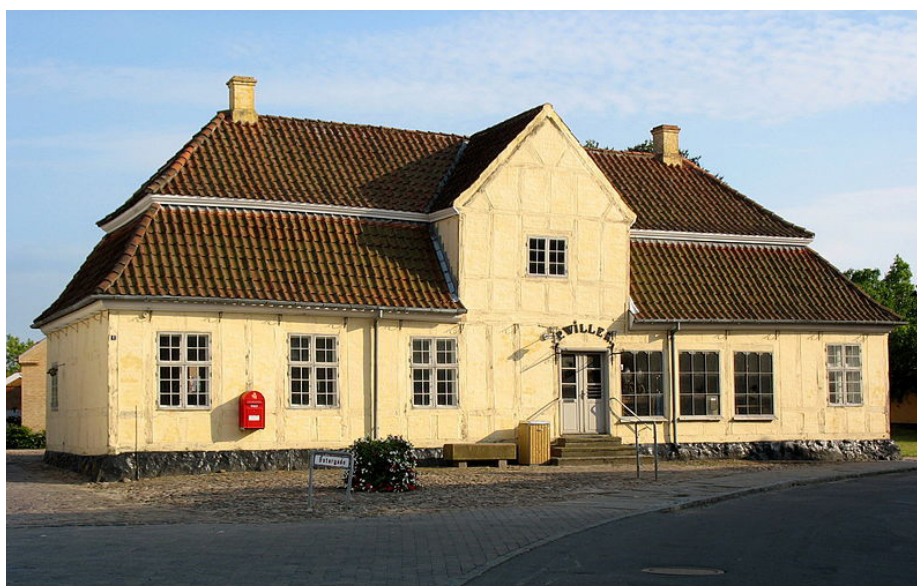
Når man finder butikker indrettet i 1700-tals bygninger, som her i Willer's Gärd i Rødby, opført i 1729, er selve butiksfacaden og -indretningen, først sket efter accisens ophævelse i 1852- hvilket bl.a. også ses ved at forretningsvinduerne er af støbejern, der først blev almindeligt omkring 1840-50.

I købstaden boede der forskellige handelsmænd, håndværkere, skippere, søfolk og andre (præster, skolelærere, læger m.fl.), der samlet blev kaldt borgere. Men selv om f.eks. håndværkerne producerede varer for at sælge dem til byens andre borgere eller de tilrejsende bønder eller søfolk, skulle al handel foregå på Torvet, og måtte ikke finde