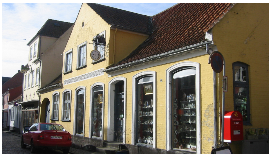
En ellers pæn og nydelig forretningsfacade – men den afskallede plasticmaling harmonerer ikke med den fine gamle ejendoms arkitektoniske udtryk. En lysende gul kalkning ville passe bedre.

Ved rekonstruktioner af ødelagte butiksfacader og især -vinduer er det ikke altid sagen at få småsprossede forretningsvinduer igen. I mange tilfælde er en enkelt, uopdelt glasflade at foretrække frem for påhit, der ikke har baggrund i husets oprindelige arkitektur.