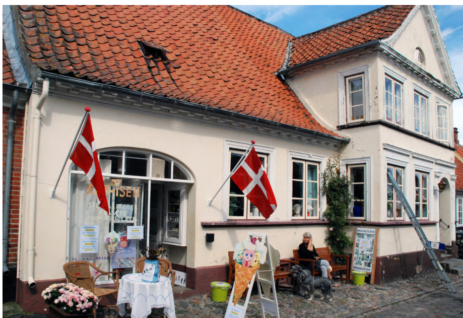
Ganske enkel og uprætentiøs iskiosk og kioskfacade – indrettet i en køreport. Helheden er stort set uberørt af indgrebet i huset og designet er både moderne og traditionelt på samme tid.

Hovedindtrykket af butiksfacaden bør være i harmoni med den øvrige del af bygningen, også hvad angår overfladebehandlinger og farver. Er huset født med en særlig fremhævnelse af underfacaden i form af for eksempel behuggede granitsten, kvaderpuds eller andre særlige pudsstrukturer, skal man udnytte sådanne træk i sin butiksfacades udseende snarere end at skjule dem. Forretningens eget særpræg kan skabes med detaljer som skiltning, belysning, vinduesudstilling og evt. markiser - ting, der underordner sig arkitekturen.