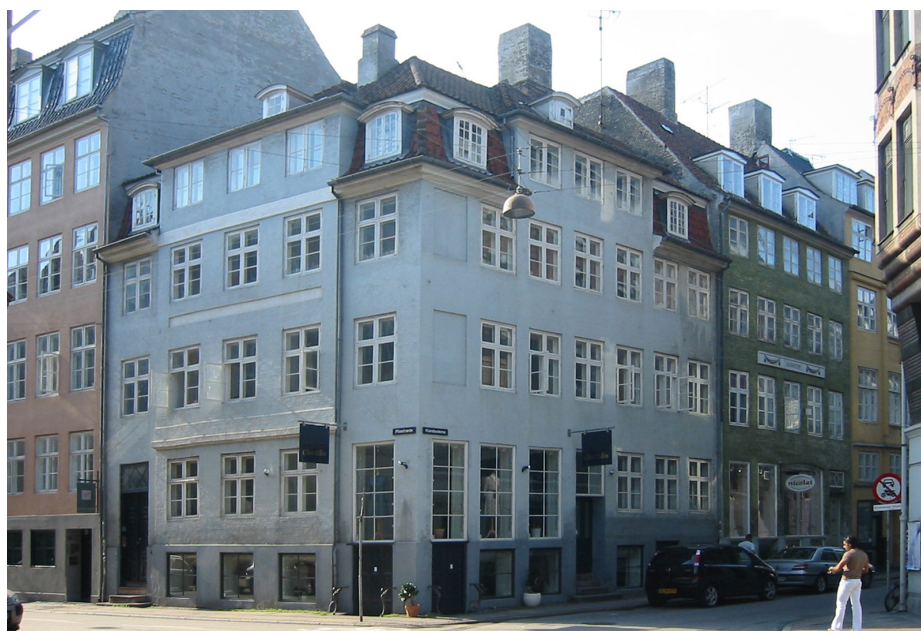
Her er forretningsvinduerne gjort større end de øvrige vinduer, for at signalere, at der findes en butik på stedet, og trods den høje placering, kan de forbigående sagtens beskue et passende vareudvalg. Vinduerne følger derudover facadetakten og de øvrige vinduers overkant. Skiltningen klares via udhængsskilte. Alt i alt en pæn og harmonisk løsning, der ikke skæmmer huset eller gaden.

denne udvidelse ske i overensstemmelse med facadens fagdeling, altså ved sammenlægning af to fag til ét fag i butiksfacaden. Sammenlægning af mere end to fag vil som regel være ødelæggende for facadens harmoni.