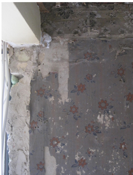
Når bløde plader eller andet tages ned fra gamle vægge kommer ældre tapeter ofte til syne, tit i mange lag. De giver et indtryk af, hvordan huset har set ud indvendigt tidligere, så det skal anbefales at tage prøver af disse tapeter forsigtigt af og gemme disse, evt. til kommende ejere af huset.

af tapetet på et område af f.eks. 20x30 cm, der indeholder samtlige tapetlag, som har været opsat i rummene. Dette udsnit kan man afløse, således at man får et samlet billede lag for lag af rummets tapeter gennem tiderne. Dette forudsætter selvfølgelig, at de tidligere beboere ikke allerede har foretaget en tilbundsående afrensning af tapeterne til pudslaget.