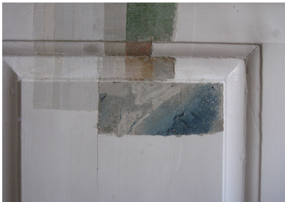
Farvetrappe – lagvis afdækning af de tidligere farvelag udført af en konservator.

Spørgsmålet om alle disse lag skal fjernes melder sig hurtigt, men forkastes i de allerfleste tilfælde i erkendelse af det kolossale arbejde, der ligger i en sådan beslutning. Som oftest er det