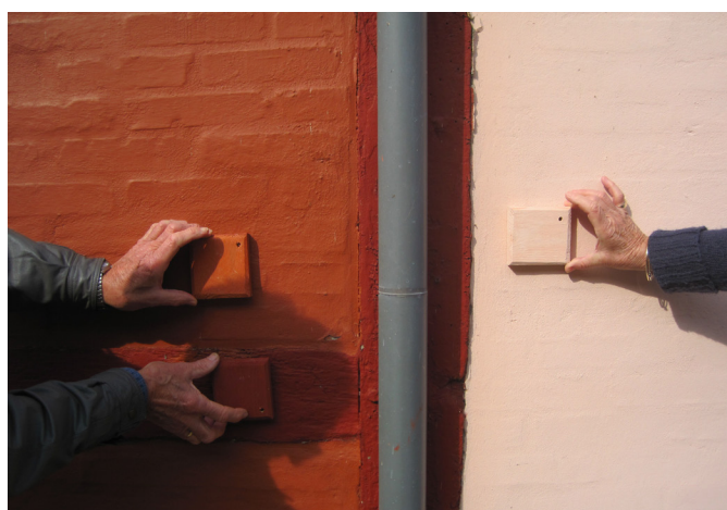
Gadeforløb i Nysted, hvor en gammelrosa facadefarve er et af de lokale særpræg. Ved at studere en gammel farve fra et stykke originalt puds kan man få fremstillet en prøvebrik med denne farve – der efterfølgende kan bruges til at farvesætte husfacaden.

nem undgår man fejlurderinger, som kan få afgørende betydning ved senere konklusioner og beslutninger for en istandsættelse. Det udtagne farvesnit indstøbes i en plastmasse, så det kan undersøges i mikroskop.