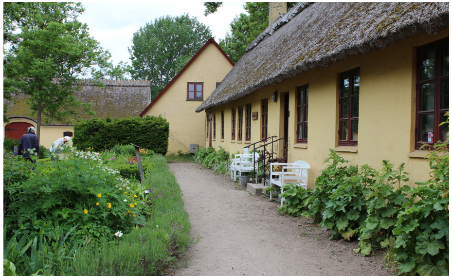
Grusbelægning blev ofte anvendt til landhusets havegange. Kun i de mest velhavende haver kom der perlegrus på gangene.

Bordursten, brosten og chaussésten hører til vore kostbareste belægningsmaterialer. De kan købes både som brugte og nye i flere forskellige farver og sorteringer, og derfor bør der altid fremskaffes repræsentative prøver, inden arbejdet påbegyndes. For at tilgodese de vigtigste ganglinier og til hjælp for gangbesværede kan bordursten, lagt som smalle bånd eller som trædesten i en brobelægning, medvirke til en både hensigtsmæssig og smuk belægning.