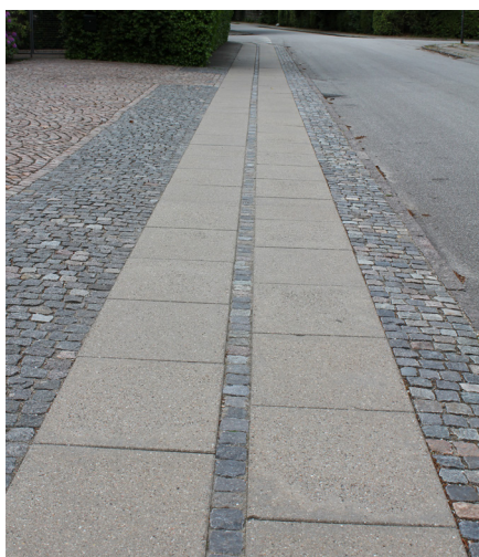
Vore almindelige fortovsfliser i beton produceres både i almindelig grå beton med affasede kanter og i en let brunlig nuance med skarpe kanter. Denne type er i sin tid produceret til Københavns Kommune og anvendes stadig i den indre by.

Alle belægninger af granitsten er meget holdbare. Materialerne er uforgængelige og kan bruges igen og igen. Almindelig renholdelse sker ved fejning. Uønsket vegetation fjernes ved lugning, afbrænding med gasflamme, ved brug af en roterende kost eller lignende mekaniske redskaber.