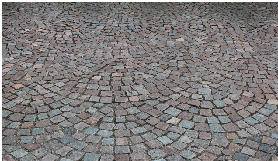
Chaussésten i buemønster.

(maskinbehandlet) overflade. Her må man være opmærksom på, at overfladen fremtræder mere glat end den stokhuggede flade. Kanterne er lige og skarpe, men kan tilvirkes den brugte stens udseende. En stokhugget overflade egner sig bedst til ældre og bevaringsværdige belægninger.