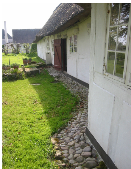
Ved huse uden tagrender anlagdes et ca. 1 m bredt pikstensbånd langs facaderne for at tage imod tagdryppet og modvirke jordsprøjt og fugtighed på væggene.

Først i slutningen af 1800-tallet begyndte man at producere betonfliser. De anvendtes udelukkende på fortove. I begyndelsen af 1900-tallet blev produktionen af betonfliser standardiseret i størrelsen 50x50 cm, og senere 40x40 cm. Først efter 2. verdenskrig kom de mange typer af betonfliser, som vi kender i dag, og betonfliser blev herefter brugt mere og mere i haverne. Specielt lagde man betonfliser i forhaven, fra havelågen til indgangsdøren.