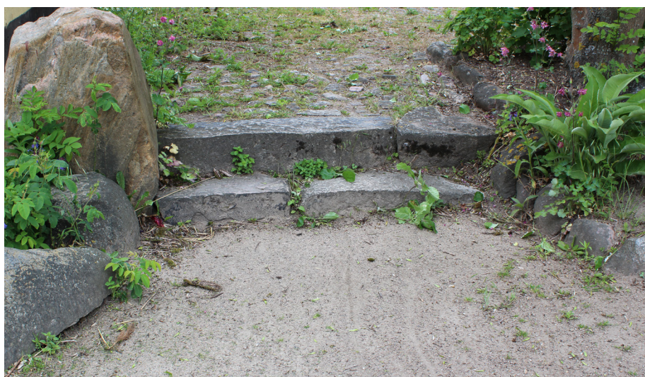
Gårdspladsens pikstensbelægning afsluttes med et par trin i rå granit, også i siderne, og går herfra over i en grusbelægning – alle naturlige materialer, der bliver smukkere og smukkere med årene, hvis de ikke får lov til at gro til. Det sidste kan til gengæld repræsentere et ret stort arbejde.

Landsforeningen Danske Anlægsgartnere: www.dag.dk indeholder landsdækkende medlemsfortegnelse, aktuelt stof, links m.v.