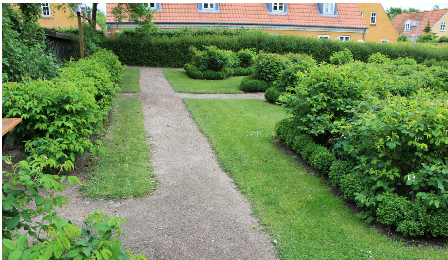
Enkel og smuk havegang udført i grus med skårne, lige græskanter.

Senere, da terrassen blev et af havens vigtige elementer, brugte man betonfliser i endnu højere grad. Til havegange anvendtes de i begyndelsen med forsigtighed. Ofte var det som brudfliser eller som trædefliser i græs og grus. Den ringe anvendelse af betonfliser i begyndelsen skyldtes sandsynligvis tidens økonomiske forhold, som derved indirekte var årsag til, at havens gulv dengang ofte var enklere og smukkere end i dag, hvor mange materialer er blandet sammen.