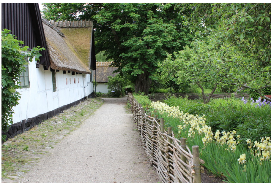
En grusbelægning, anlagt efter de bedste forskrifter, vil ofte være langt at foretrække ved et ældre hus eller gård end døde og forfladigende betonfliser.

Anvendelsen af brostenenes nye efterligning – betonbrosten i sorte,