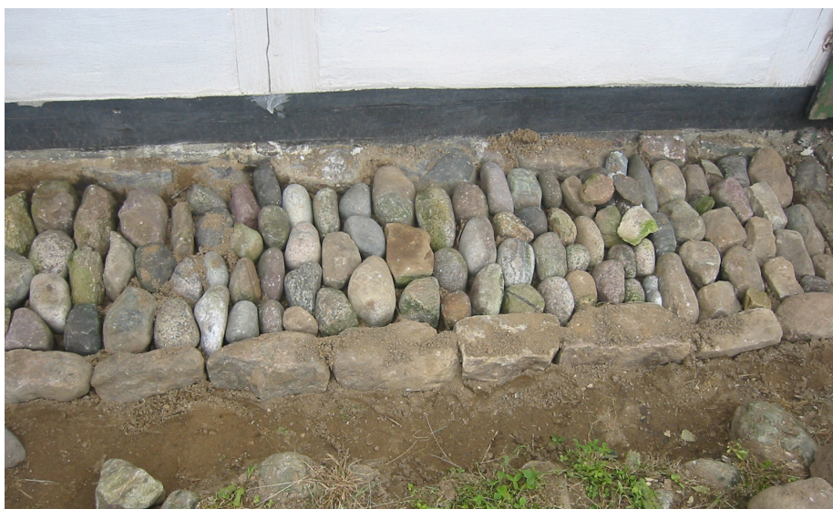
Bondegårdens pikstenskant rundt om de stråtekte længer kan give lidt 'bymæssige' minder, udført som et lille fortov, dog alt for smalt til at gå på, men med kantsten og sirligt lagte strandsten vinkelret på kanten.

Grusbelægningernes mindre anlægsudgifter modsvarer af større vedligeholdelsesudgifter. Bro- og