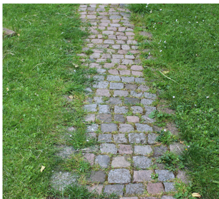
En mere 'udflydende' havegang udført med chaussé-sten.

Både bordur- og kantsten fandtes i længder fra 50 til 200 cm. Bordur- og kantsten kan i dag købes både som brugte og nye granitsten. De findes i længder mellem 50-200 cm. Nye bordursten kan bestilles efter mål. De fremstilles ofte med en jetbrændt