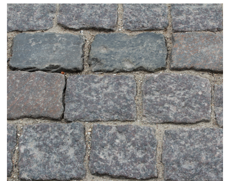
Stenene tages op og bruges igen, når de underliggende grusbærelag er udskiftet og rettet op.