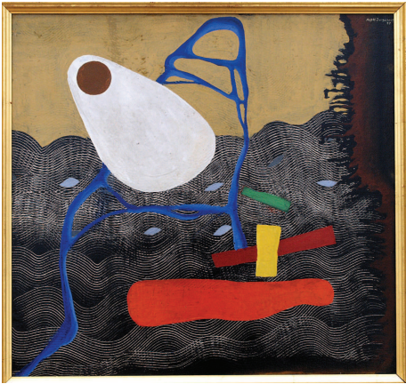
Asger Jorn, Uden titel . 1937. 66 x 70 cm