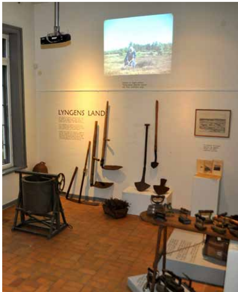
To gamle nyheder: Madpakker til de døde og Lyngens land.