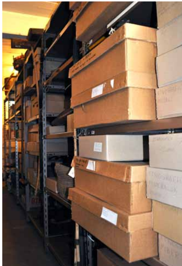
Et lille kig bag kulisserne på Ringkøbing-Skjern Museum.

I 2007 smeltede Ringkøbing Museum og Skjern-Egvad Museum sammen til Ringkøbing-Skjern Museum. Med 100 års indsamling på bagen er sådan en fusion lettere sagt end gjort. For et museum samler ikke kun på ting og sager. Det samler lige så meget på oplysninger om ting og sager. Når det kommer til at