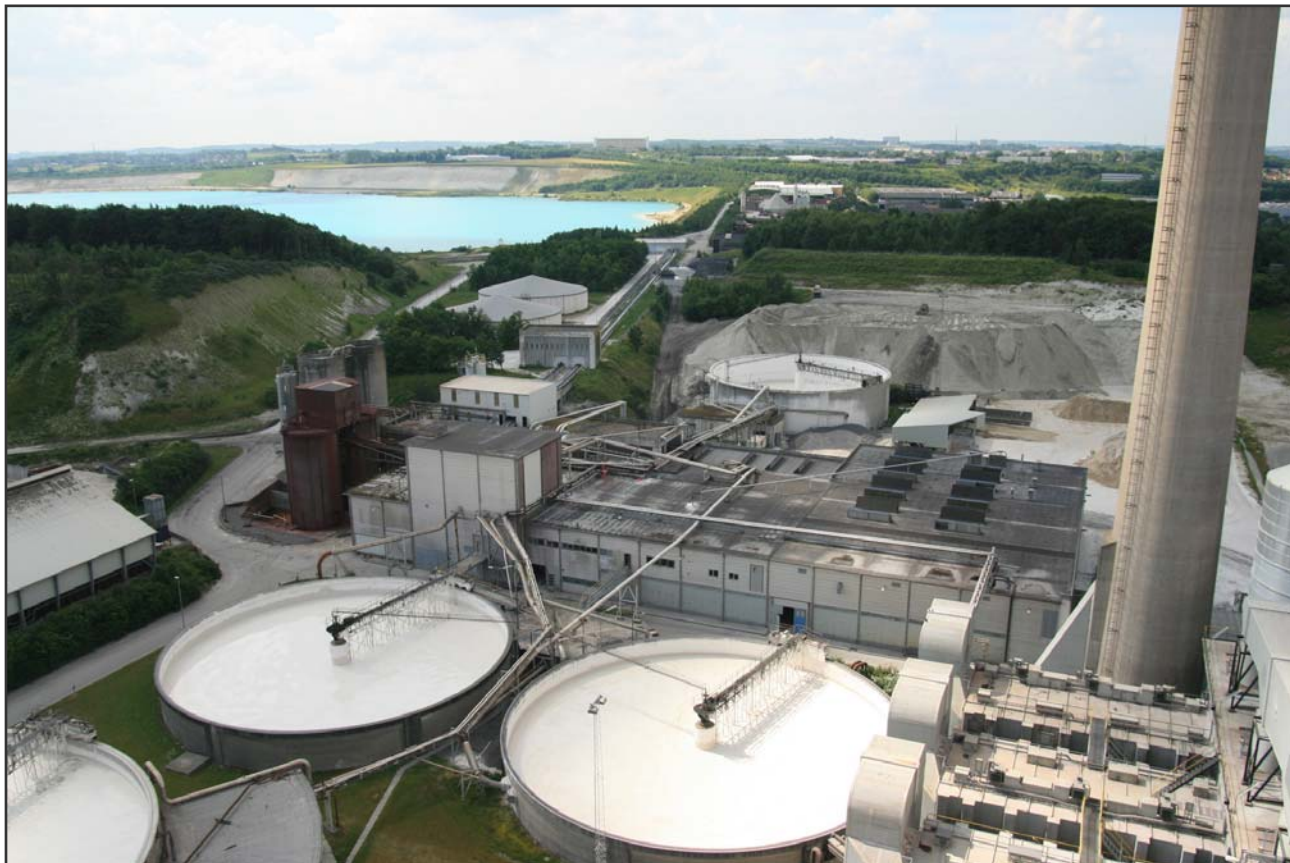
Fig. 4: På bygningskulturens dag inviterede Aalborg Portland på rundtur i et industrilandskab i verdensklasse.

industrikulturen på bygningskulturens dag 9. september 2007, hvori endvidere indgår en sejltur fra og til Østre Havn med besøg på de to nationalt udpegede industriminder: Spritfabrikken og Aalborg Portland Cementfabrik (bilag 5).