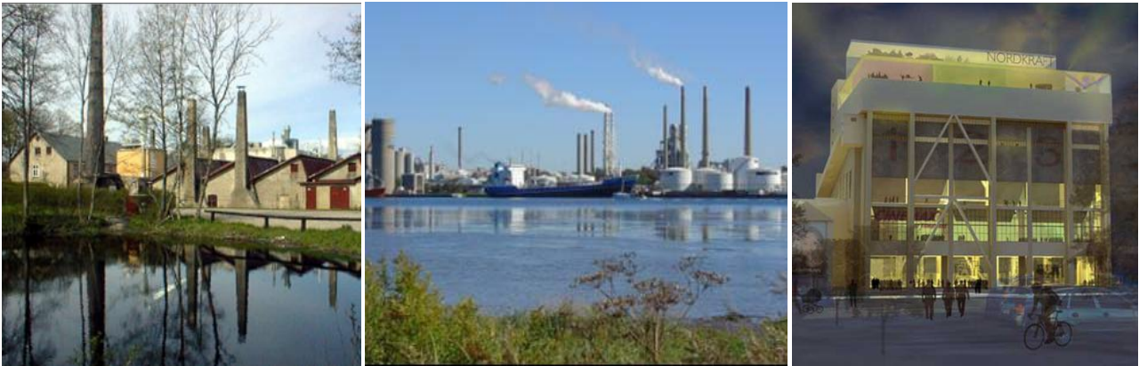
Figur 2: Industrikulturarvens betydning i fortid, nutid og fremtid repræsenteret ved Zincks fabrikker i Godthåb, der udgør et velbevaret eksempel på områdets tidligste industrier og som nu er indrettet som museum, Aalborg Portland cementfabrik i Rørdal, der fortsat er et velfungerende internationalt industriforetagende, samt Nordkraft, hvor ønsket om at bevare et markant stykke industriarkitektur går hånd i hånd med visionerne for et nyt kultur- og oplevelsescenter på Aalborg Havnefront.