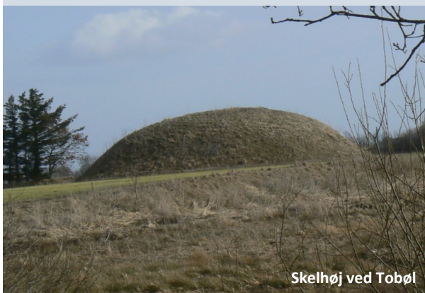
Skelhøj ved Tobøl

Flere af bronzealderens gravhøje blev bygget, så kisten med den døde er bevaret til i dag