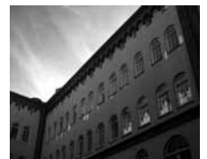
GRØNS VAREPAKHUS HOLMENS KANAL 7 1060 KØBENHAVN K