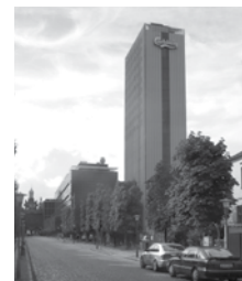
CARLSBERG NY CARLSBERGVEJ 100 1760 KØBENHAVN V