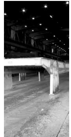
FREDERIKSVÆRK 3300 FREDERIKSVÆRK