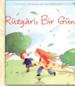
Rüzgarlı bir gün Anna Milbourne