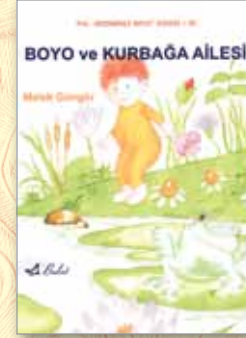
Boyo ve kurbağa ailesi Melek Güngör