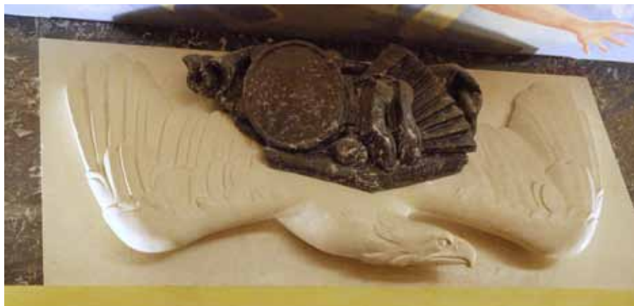
Svend Rathsack: Dansen. Marmorrelief.