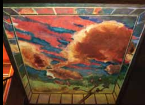
Oluf Høst (1884-1966)