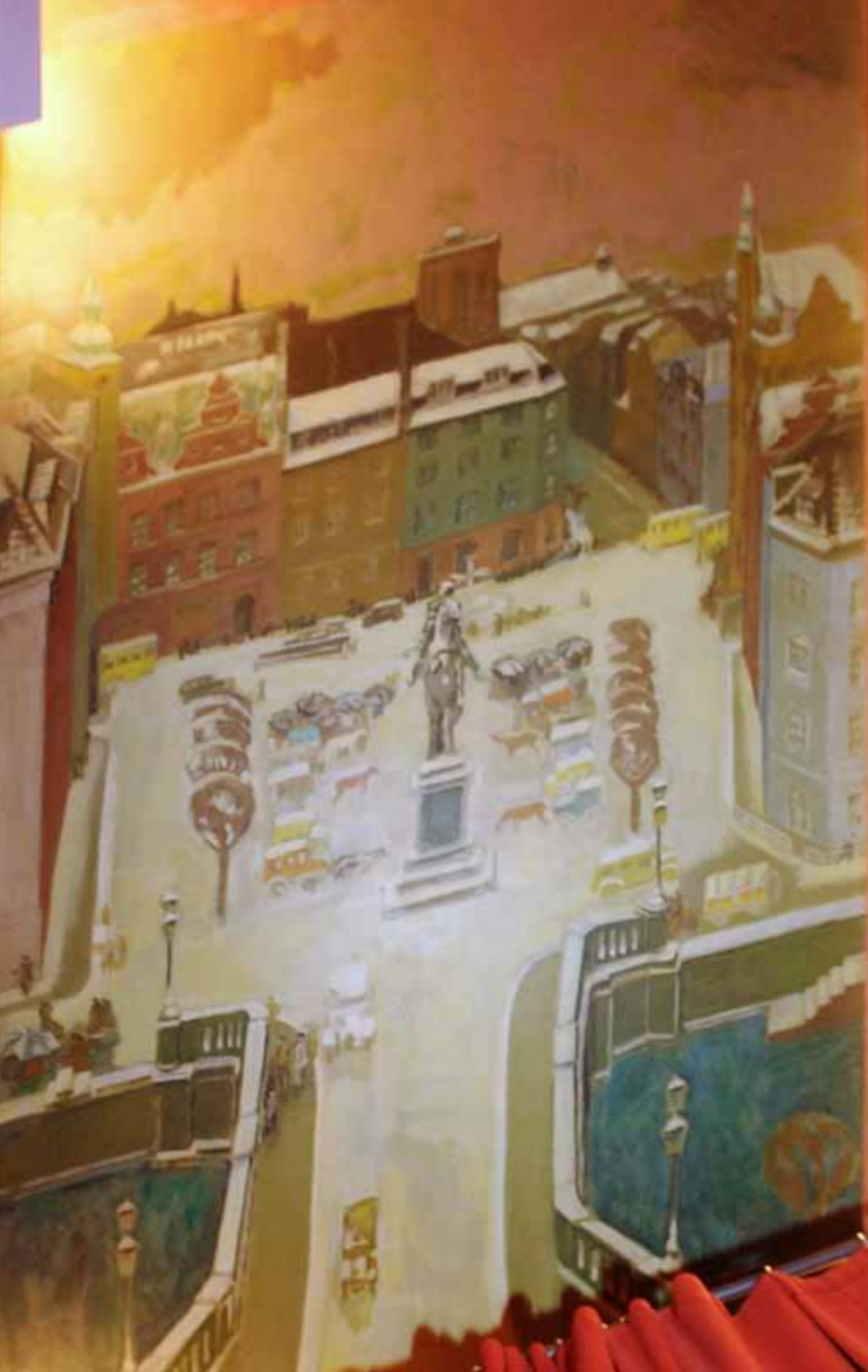
◀ Højbro Plads med rytterstatuen af Absalon i forgrunden