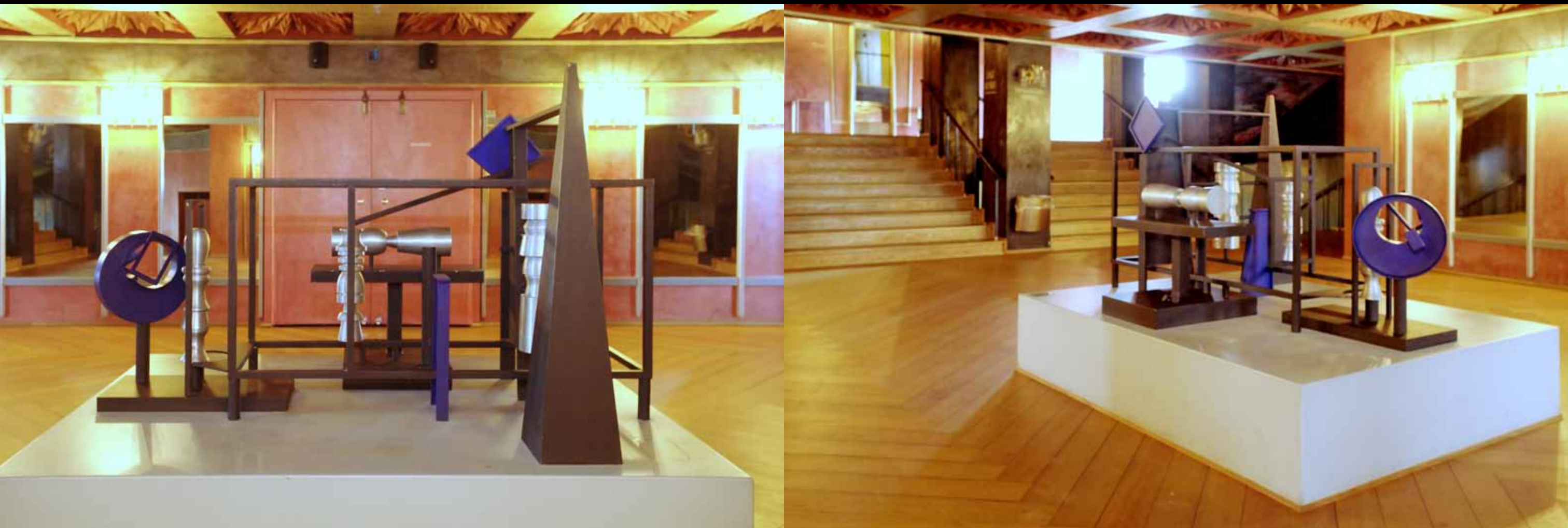
På øverste etage en skulptur i jern af Robert Jacobsen (1912-1993), inspireret af Harald Landers ballet Etudes. Udført 1978