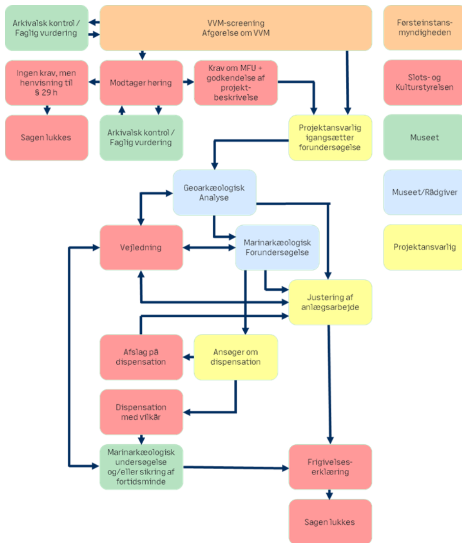
Fig. 2 Procesdiagram, der angiver processen fra en marinarkæologisk sag opstår, til sagen lukkes. Skal læses oppefra og ned. Gul udføres af den projektansvarlige. Orange afgøres af den pågældende førsteinstansmyndighed. Rød afgøres af Slots- og Kulturstyrelsen. Blå udføres af projektansvarlige, som kan rekvirere arbejdet ved et museum. Grøn udføres alene af det ansvarlige marinarkæologiske museum.

førsteinstansmyndigheden om, at projektansvarlige har efterkommet kravet om en marinarkæologisk undersøgelse, samt hvilke arealer og dybder der er frigivet til projektet.