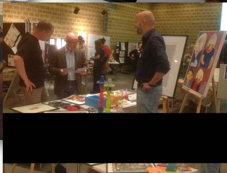
Bazardag for Skoletjenestetilbud i Randers