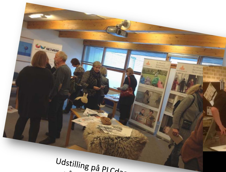
Udstilling på PLCdag på CFU Esbjerg