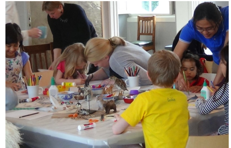
Billede fra familiearrangement