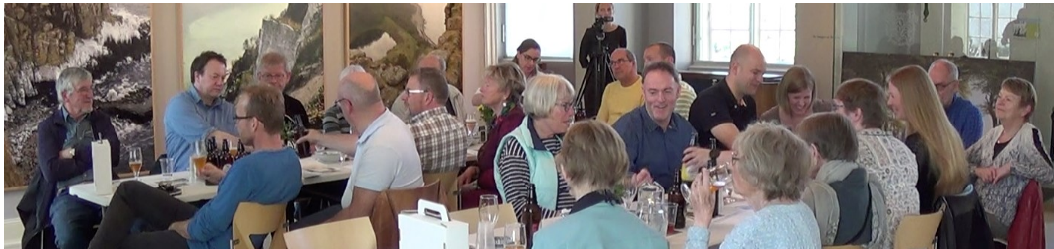
Billede fra voksenarrangement