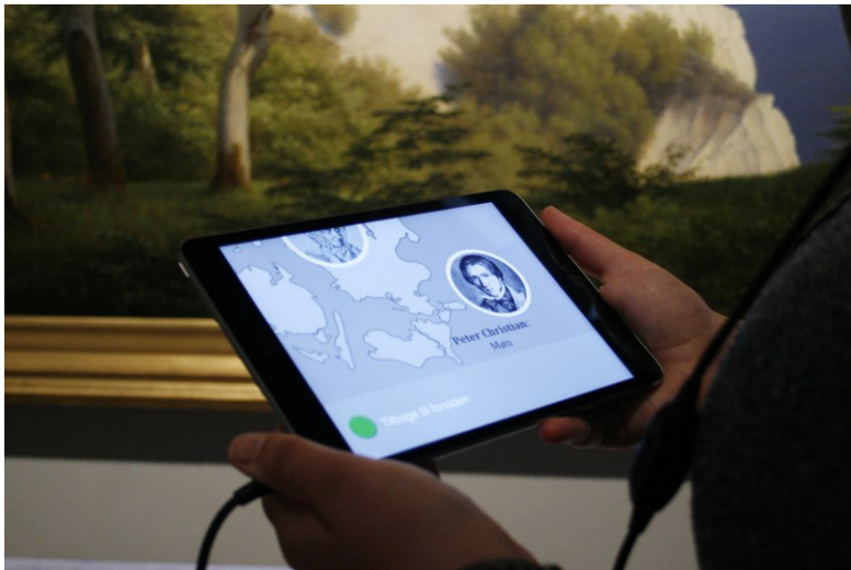
Billede fra audio-visuel fortælling