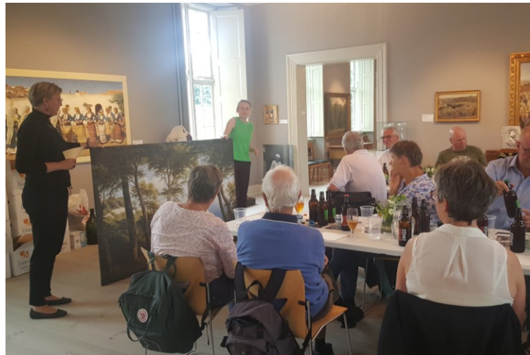
Billede fra Voksenarrangement