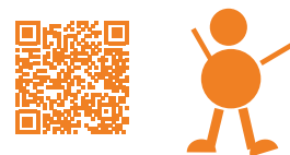
LEDER OG MEDARBEJDER I DAGTILBUD