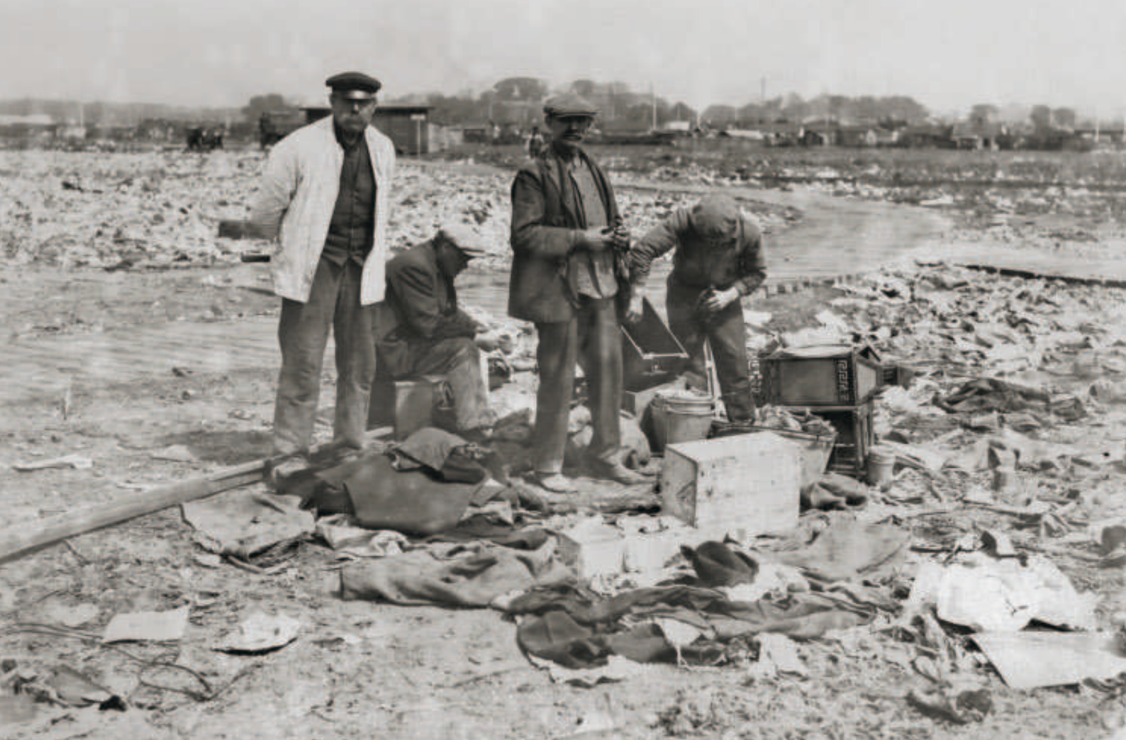
Fig. 1. Den urbane materielle kultur har mange facetter. Her øjebliksbillede fra en losseplads på Kongens Enghave i København i 1930'erne.