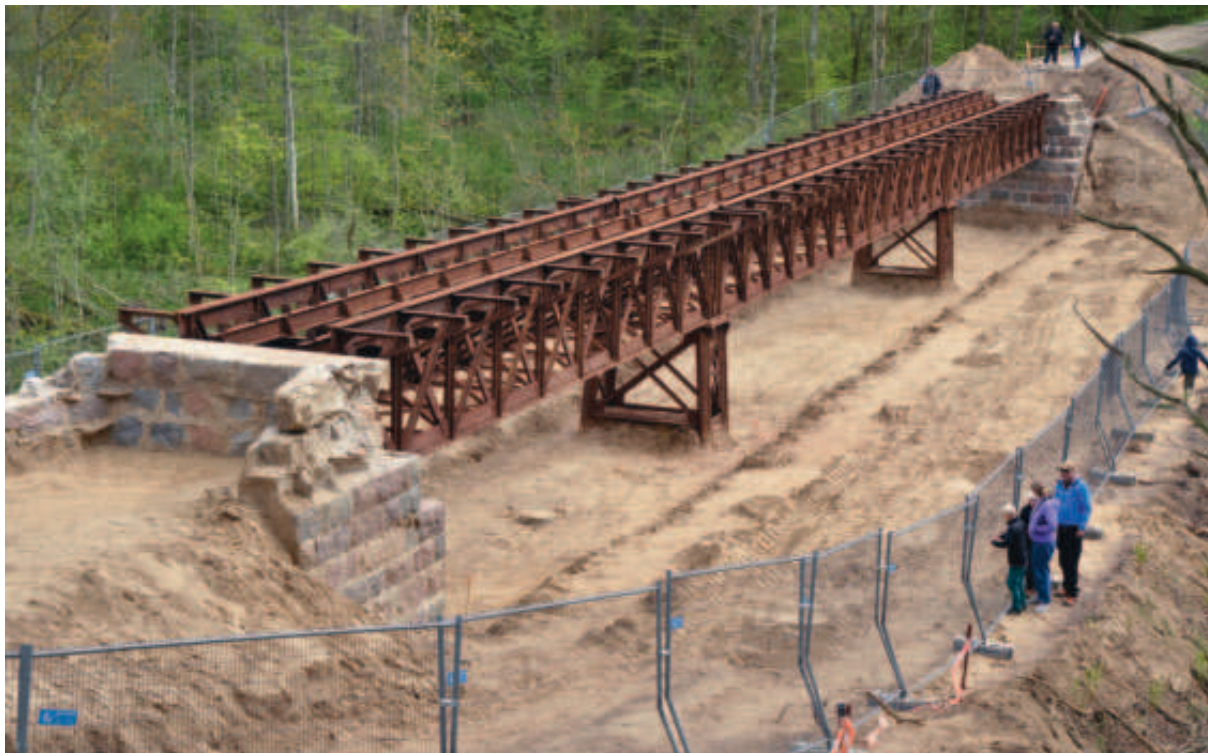
Fig. 2. Udgravningen af en 1900-tals støbejerns-jernbanebro i Vestbirk i foråret 2014 er et fint eksempel på, at interessen for de industrielle monumenter er stor.

af den historiske udvikling inden for de sidste 500 år, og industrialiseringen spiller en helt central rolle i forhold til udviklingen inden for den materielle kultur og urbaniseringen. Industrialiseringen er en medvirkende faktor til byens ekspansion og den øgede affaldsmængde. Industrialiseringen afspejler sig også i affaldet i form af industriel produktion og affald fra industriel fremstilling (fig. 1).