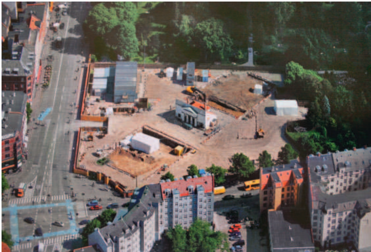
Fig. 3. Udgravning af Assistens Kirkegård i København med begravelser fra 1800- og 1900-tallet.

livet og mennesket i de efterreformatoriske perioder, og set i sammenhæng med den øvrige materielle kultur kan vi her få informationer om det enkelte menneske og dets etnicitet, ernæring, forurening og livsvilkår.