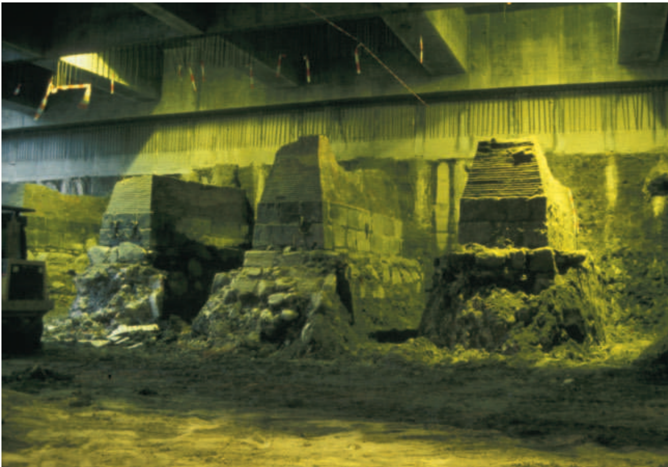
Fig. 4. Nørreport Hovedbro i København under udgravning i 1999.

anden væsentlig gruppe af arkæologiske undersøgelser. Begrebet strukturer dækker byens fysiske udformning, som den dokumenteres ved bygningsarkæologiske undersøgelser, og tekniske strukturer, såsom byens befæstning, bolværker og broer, og infrastrukturelle elementer som for eksempel vejforløb. Denne type undersøgelser udgør hoveddelen af det nyere historisk arkæologiske arbejde i byerne. Der er tale om undersøgelser, der giver mange oplysning-