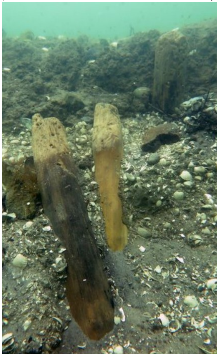
Sejlspærring - Lodretstående pæle

Husk, at vi alle har et ansvar for at bevare vores kulturarv. God dykning! 🧭🔍