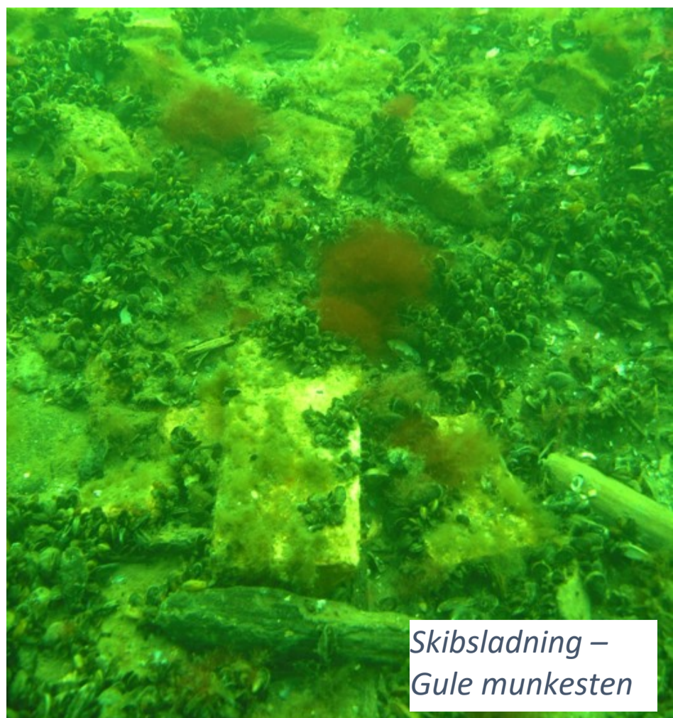
Skibsladning – Gule munkesten