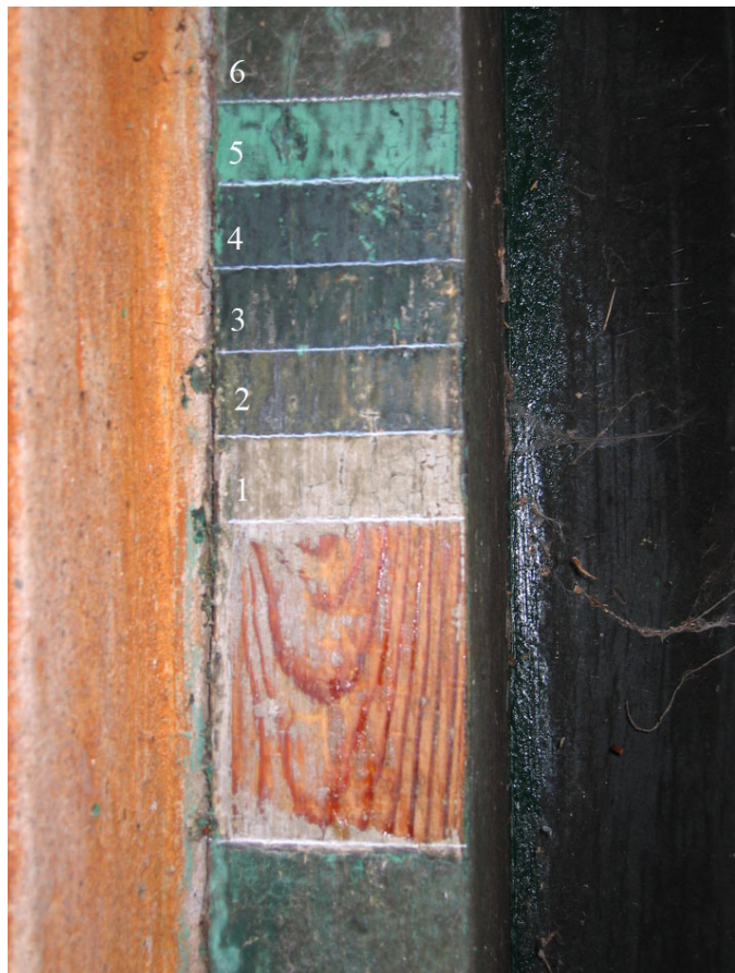
Fig. 5. Lagvis afdekning af malingslagene på hoveddørens dørkarm. Den nordvendte gavl. Døren har været malet i alt seks gange. Det ældste lag er en hvidgrå farve efterfulgt af tre næsten sorte farve. Lag 5 har været en mættet, grøn farve, og det nuværende malingslag er den sorte farve, der også har været brugt i tre tidligere perioder. Det er nærliggende at antage, at farverne, der er fundet på hoveddøren i gavlen, også har været brugt på husets hoveddør og skodder – se fig. 6.