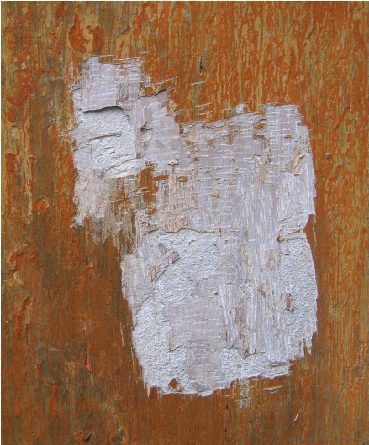
Fig. 9. Afdækningsprøve på trappetårnets murværk. Inderst på det hvidkalkede puds ses et lyst, rødligt/blåligt kalklag (caput mortem?). Et farvelag, der er gentaget to gange og ikke er fundet andre steder på den nederste del af facaden.