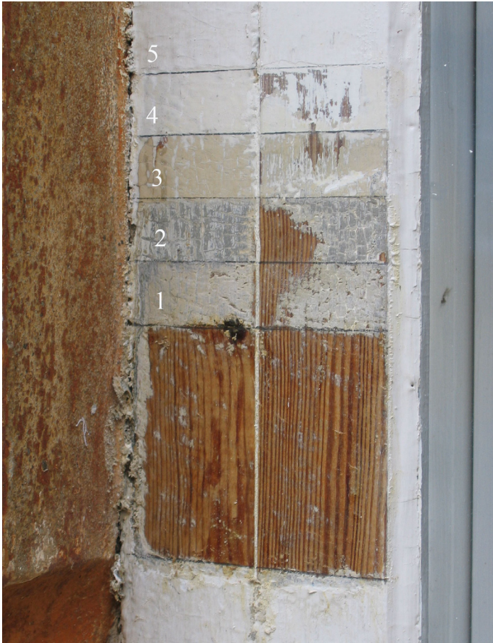
Fig. 4. Lagvis afdekning af malingslagene på vindueskarm og -ramme i stueetagen i tilbygningen (vestfacade). Det andet vindue fra trappetårnet. Her er der fundet de samme farvelag som vist på fig.2. De to vinduer har samme alder selv om udformningen af rammernes hjørnebånd ikke er ens. På det der burde være det ældste vindue er hjørnebåndet indfældet i træet.