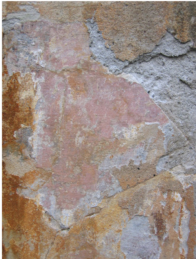
Fig. 7. Detalje fra vinduesbrystning i stueetagen på tilbygningen ind mod gårdspladsen.