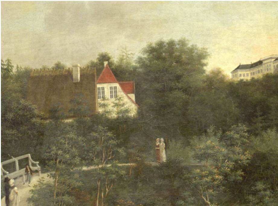
Fig. 1. Maleri af C. Mørch 1807. Facaden er malet hvid – formentlig kalket, og vinduerne er også malet hvide. På taget er der røde tegl, og udhullslængen er stråetækket.

Den ældste del af huset er opført af J.C. Krieger i 1723-24 og var et simpelt længehus i en etage. I 1813 bliver der bygget en sidefløj på huset af arkitekt Boye Magens – også i en etage. Hele anlægget forhøjes med en etage i 1828 af arkitekt Jørgen Hansen Koch til nuværende udseende.