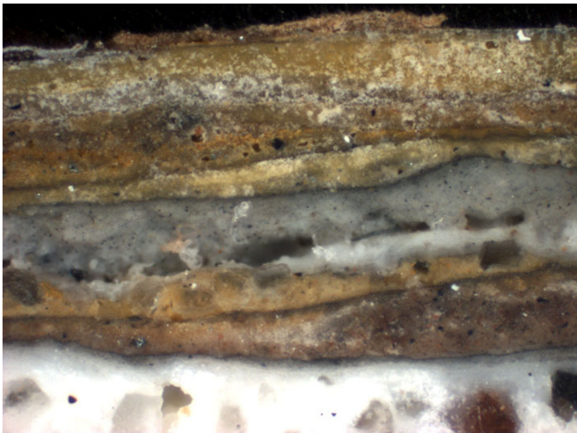
Fig. 8. Farvesnit (puds med kalklag) udtaget på den ældste del af Fasangården ind mod gårdspladsen.

Men længere op på murværket i - første sals højde - kan der ikke fra gårdspladsen ses spor efter den lyserøde kalkning. Når facaden engang bliver dækket af stillads, skal der foretages supplerende undersøgelse på murværket under gesimsen, hvor kalkningslagene ser ud til at være velbevaret.