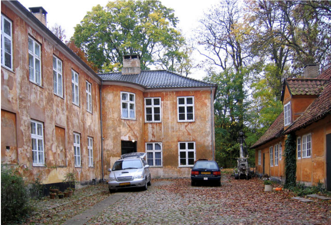
Fig. 2. Gårdspladsen set fra syd. Facaden er i stærkt forfald og murværket bærer præg af utallige reparationer af puds og farvelag.

Huset og længen er kalket med jernvitriol (ferrosulfat) i en ret mørk, rødlig farve med sortmalet sokkel. Vinduerne er malet hvide og dørene er malet med en sort farve. 1