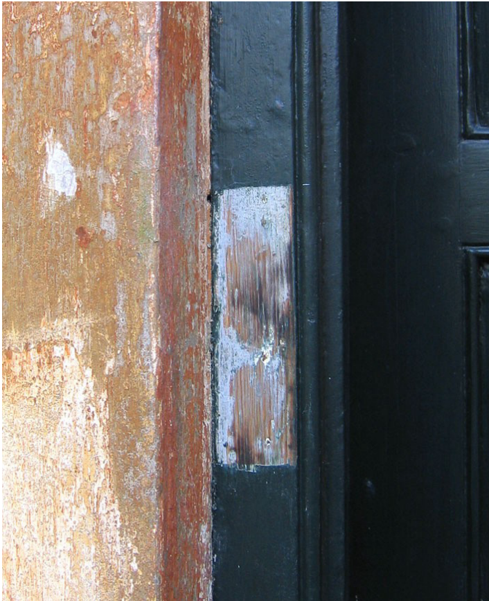
Fig. 6. Afdækning af malingslagene på dørkarmen ind til trappetårnet med tydelige brændspor efter malerens blæselampe. Kun rester af karmens første malingslag – en lysegrå farve – er delvis bevaret.