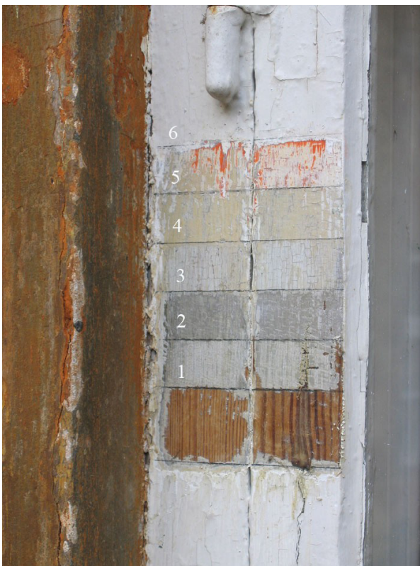
Fig. 3. Lagvis afdekning af malingslagene på vinduet i stueetagen i den ældste del af bygningskomplekset. Vinduet vender ind mod gårdspladsen - tæt på den vestvendte gavl. Vinduet har været malet seks gange i alt og hver gang med lyse, grå nuancer.