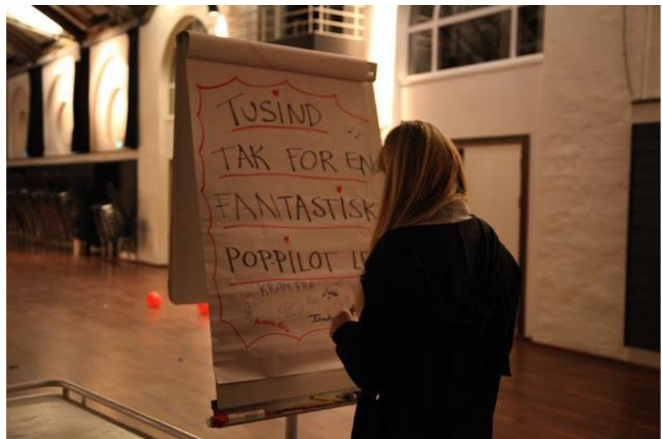
Pop-Pilot i Randers, oktober 2015

For at undgå at talentarbejdet blot bliver nogle få, uafhængige nedslag henover året, har vi besluttet at oprette en hjemmeside, der i første omgang anvendes til Turbinens projekter. Hjemmesiden bliver en del af www.Turbinen.dk . Siden skal præsentere projekter, samt endnu vigtigere følge de udøvende og deres udvikling. Vi vil arbejde på, at denne hjemmeside bliver central for hele byens talentarbejde, så det på sigt er her, andre af byens aktører præsenterer egne forløb.