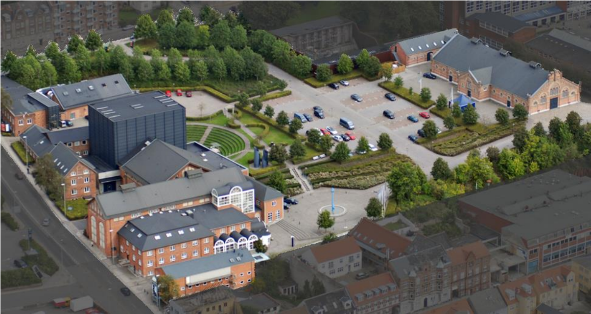
Turbinen/Værket set fra oven

Som beskrevet i ansøgningens indledning, så er Turbinen/Værket en del af et større kunstnerisk og institutionelt fællesskab med musikskole, basisensemble og egnsteater i samme bygningskompleks. Og dertil er vi som kommunal institution en integreret del af Randers Kommunes forvaltning med de fordele, det giver, f.eks. i forhold til direkte adgang til skoleforvaltning og kultur/fritidsforvaltning. Turbinen prioriterer med denne ansøgning talentarbejde og læringsforløb højt, og det er vores forventning, at overstående organisatoriske forhold – samt opbakningen fra kommunen - vil være et særdeles godt udgangspunkt for spillestedets arbejde på dette område.