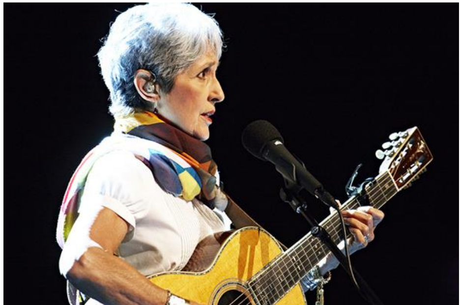
1.maj 2011 / Joan Baez

Turbinen/Værket har en efterhånden lang tradition for at afholde koncerter med verdensnavne inden for genrer som f.eks. country, folk og bluegrass.(Lyle Lovett, Willie Nelson Rosanne Cash, Joan Baez, Crosby & Nash m.fl.) Der arbejdes på at afholde Master Classes og andre aktiviteter i Turbinen i forbindelse med stjernernes koncerter på Værket.