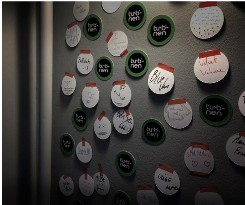
Share your favorite band – publikums væg