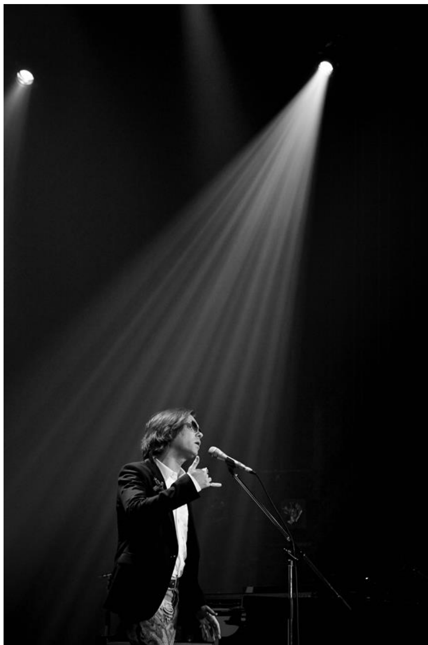
29. november 2012 / Rufus Wainwright