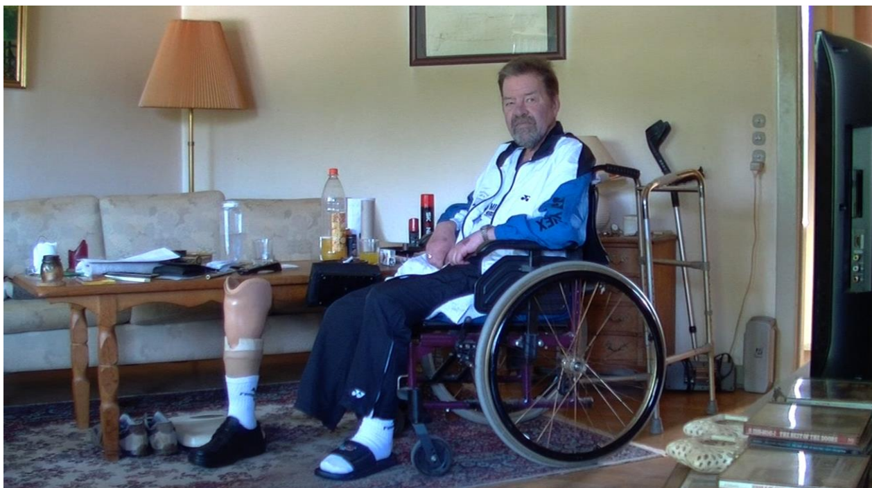
Still fra 3D dokumentaren "Middelfart i Gennemsnit"

I bedste fald rummer og viser al dokumentation også hvad man kan kalde for fortolkningsrummet som selve fremvisningsformen i sig selv skaber. Og netop fortolkningsrummet er for museets vedkommende måske et grundvilkår som blot vokser sig større jo længere man fjerner sig i tid og dermed ekstakt viden om en genstand eller en hændelse?