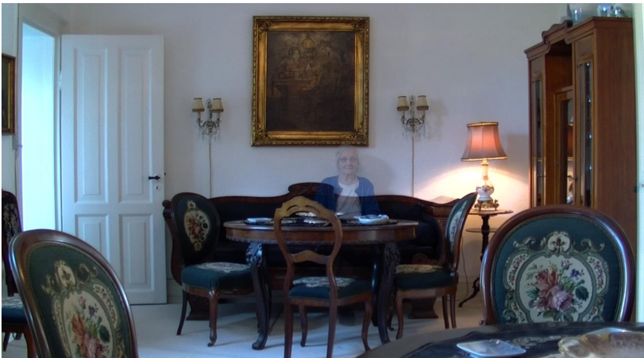
Still fra 3D dokumentaren "Middelfart i Gennemsnit"

Man kan også "klippe med kameraet", forstået på den måde, at den måde man bevæger kameraet på viser ting i en bestemt rækkefølge og dermed i sig selv rummer en række "klip" i form af en række fokuspunkter som afløser hinanden hurtigt nok til at der er en fortløbende dynamik, og ikke nogen "døde" steder i optagelsen.