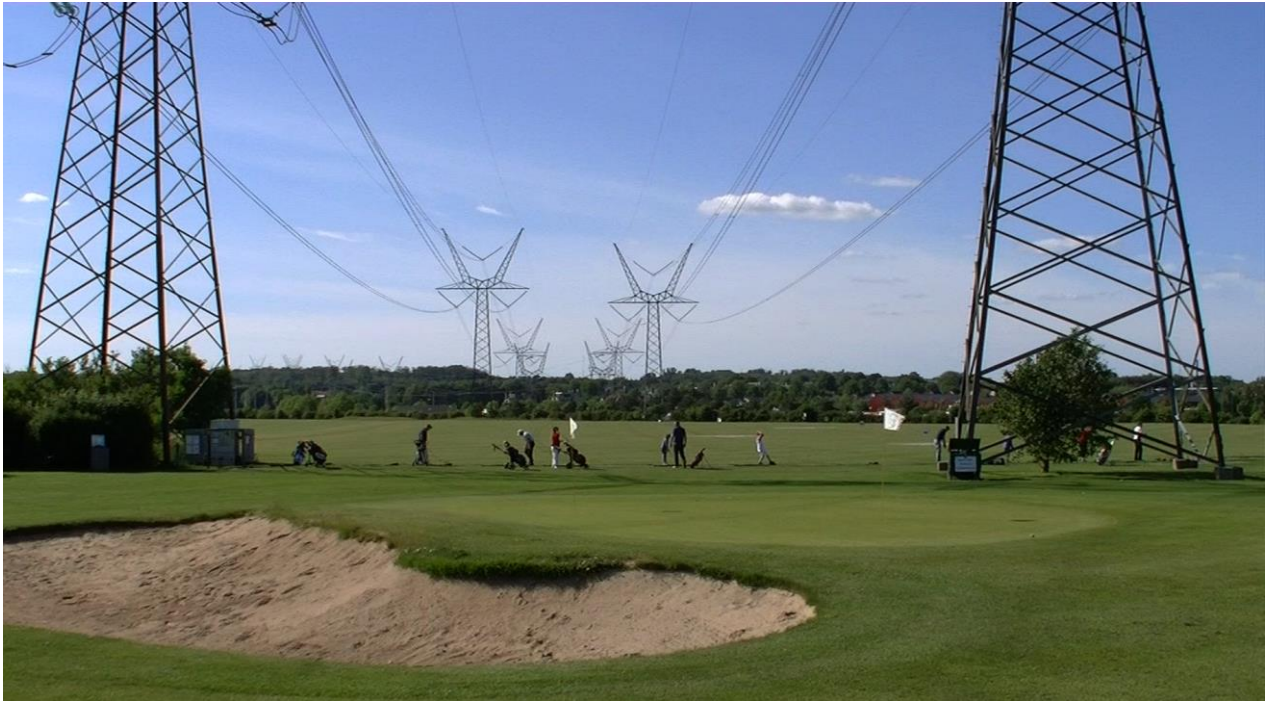
Still fra 3D dokumentaren "Middelfart i Gennemsnit"