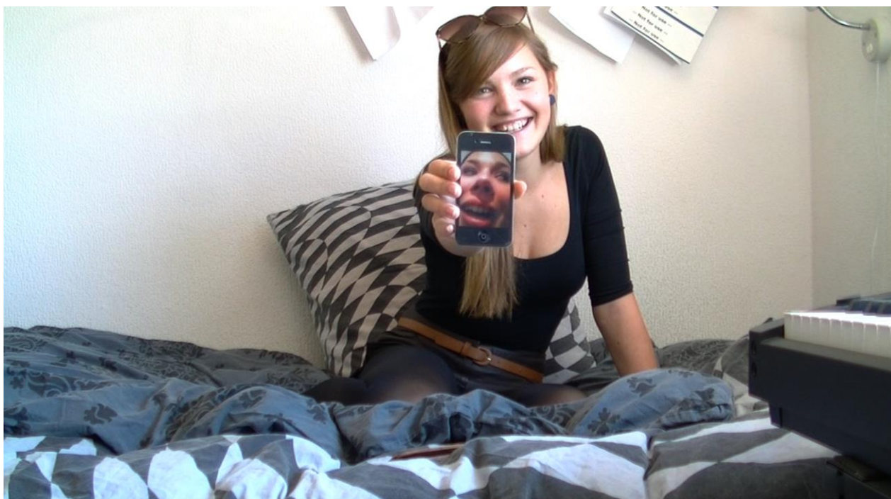
Still fra 3D dokumentaren "Middelfart i Gennemsnit", kategori O13 i "Saglig Registrant for kulturhistoriske museer": "Objekter til personlig brug"

I et interview er det begavet at mistænke sig selv for uvidende.