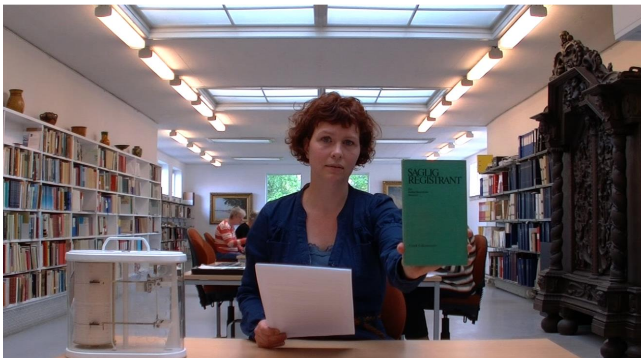
Still fra 3D dokumentaren "Middelfart i Gennemsnit", kategori T i "Saglig Registrant for kulturhistoriske museer": "Museums historie"

Dokumentarfilmens klassiske form er "fluen på væggen", hvor man med sit kamera opholder sig så lang tid sammen med den eller de som filmes, at de ganske enkelt glemmer kameraets nærvær og derfor agerer virkeligt og uhildet. Idealet er oplevelsen af objektivitet og derfor er denne form for dokumentar ofte uden voice over (som jo ofte er instruktørens), dvs. at personerne og deres virkelighed "fortæller sig selv" (men jo stadig er udvalgt og redigeret).