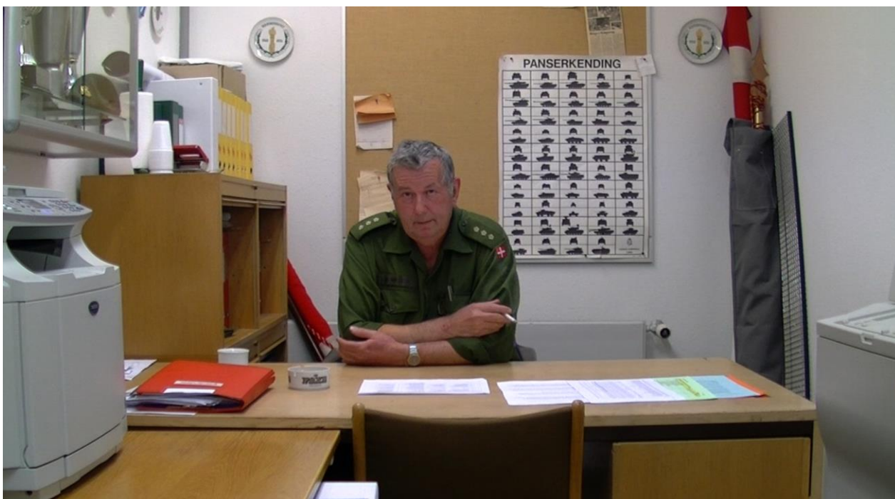
Still fra 3D dokumentaren "Middelfart i Gennemsnit"

”Rigtige” kameraer har desuden ofte en langt bedre mikrofon - eller endnu bedre, mulighed for at sende et eksternt mikrofonsignal ind i, for eksempel fra en trådløs telefon.