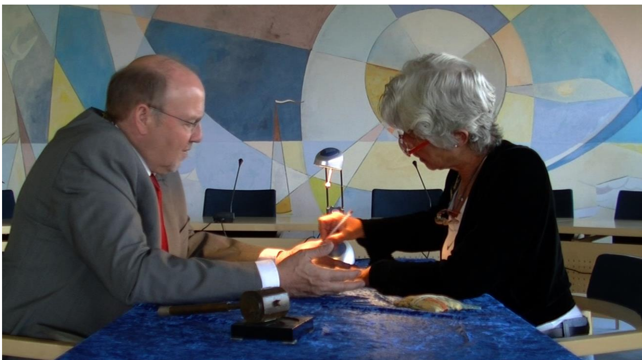
Still fra 3D dokumentaren "Middelfart i Gennemsnit", kategori D21B i "Saglig Registrant for kulturhistoriske museer": "Stat og Samfund, inklusiv "kloge koner." En clairvoyant læser borgmesteren i Middelfarts hånd.

Tillid forudsætter at man forklarer og motiverer hvorfor og i hvilken sammenhæng man gerne vil lave et interview. Dette vil oftest betyde personligt møde(r) uden kamera eller lydoptager, da disse redskaber til at begynde med i sig selv kan være intimiderende. Det er vigtigt at interviewpersonen oplever at kunne tale frit - specielt om sine eventuelle bekymringer om at blive interviewet og i forhold til hvilken sammenhæng materialet skal anvendes.