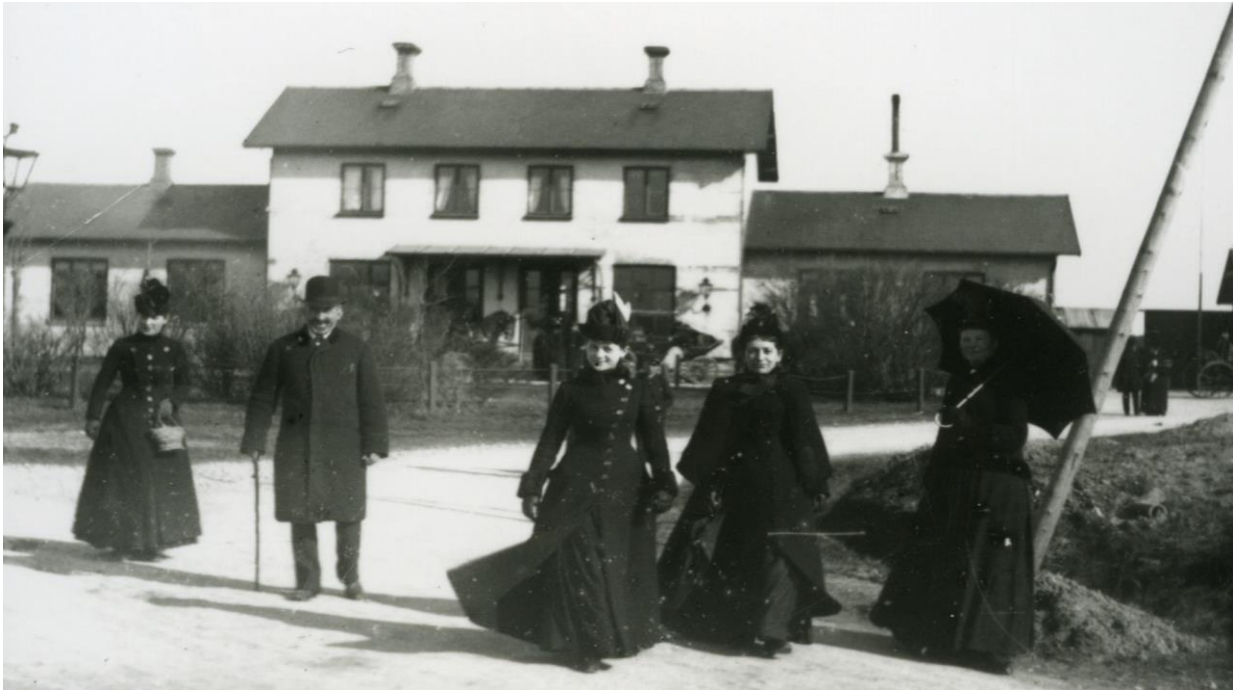
Still fra 3D dokumentaren "Middelfart i Gennemsnit", historisk 3D billede, ca. 1910.