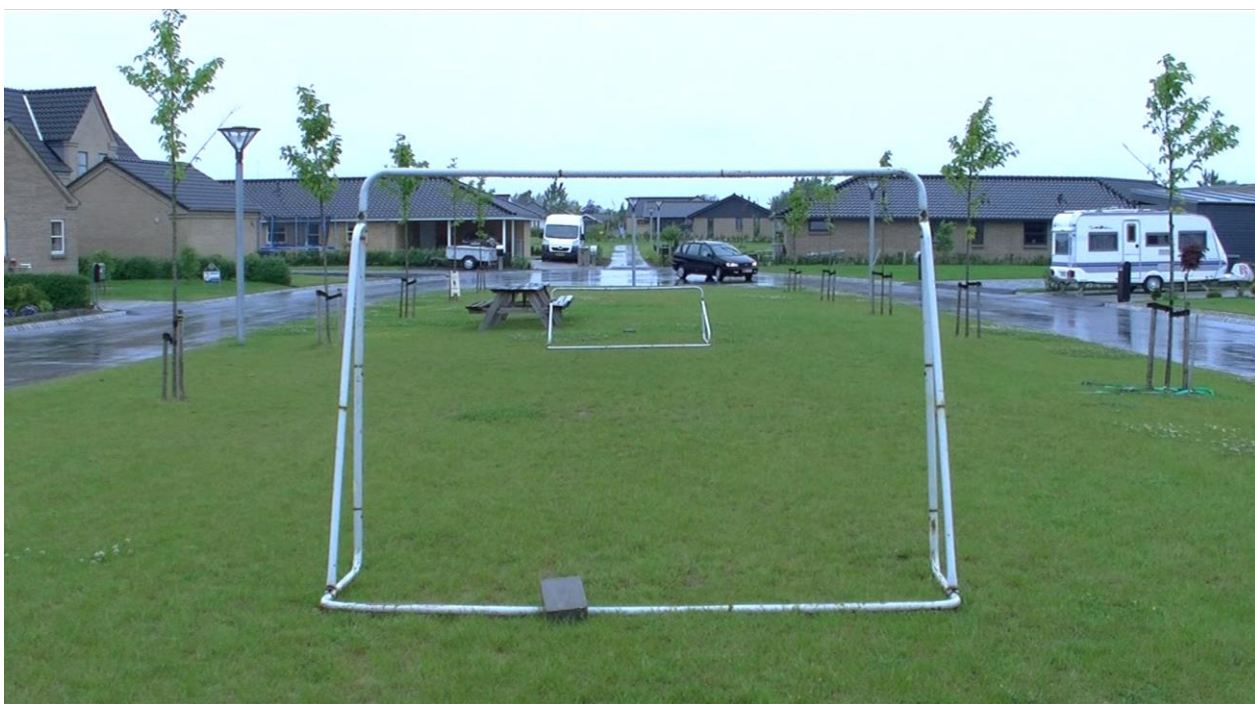
Still fra 3D dokumentaren "Middelfart i Gennemsnit"

I denne manual er det imidlertid det helt simple interview set-up som skal berøres og det vigtigste er at være opmærksom på at alt, hvad som er i billedet, rummer betydning.