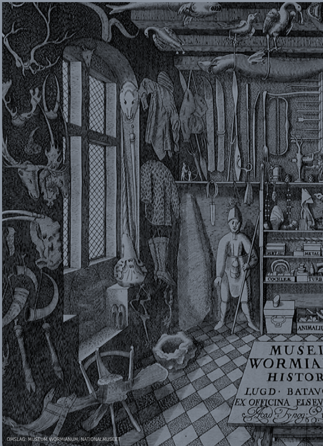
OMSLAG: MUSEUM WORMIANUM, NATIONALMUSEET