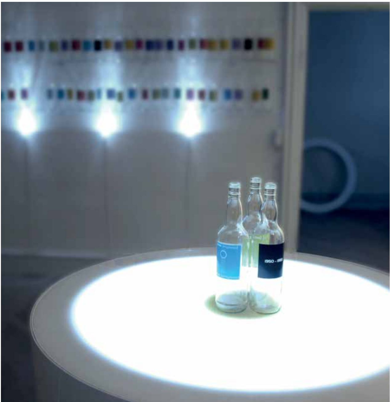
> Installationsfoto: Mogens Jakobsen, Hørbar , 2008, Museet for Samtidskunst