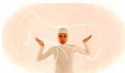
> Videostill: Lilibeth Cuenca Rasmussen, The Present Doesn't Exist in My Mind - The Future is Already Far Behind , 2009.