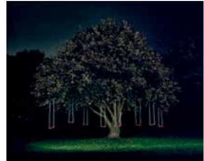
> Foto: Astrid Kruse Jensen, Constructing a Memory , 2006, Sorø Kunstmuseum.