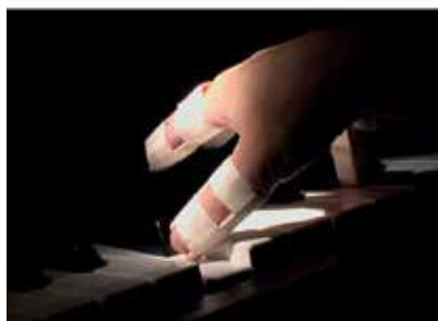
> Videostills: Su Mei Tse, Das Wohltemperierte Klavier , 2001