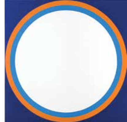
> Poul Gernes, Skydeskive , 1967, Sorø Kunstmuseum.