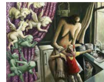
> Michael Kvium, En køkkenscene , 1986, Sorø Kunstmuseum.