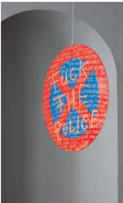
> Objekt: Brad Downey, Untitled , 2010.