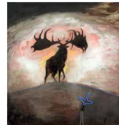
> Nina Sten-Knudsen, I am a stag of seven tines , 1985, Sorø Kunstmuseum.

Hvad handler værkerne om? Hvilke farver er brugt og hvorfor? Hvilken sammenhæng er værkerne placeret i (på museum, i det offentlige rum, en performance)? Hvad er de lavet af? Hvad er budskabet? Hvordan afspejler byrummet vores tid?