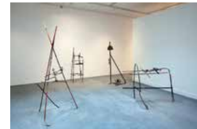
> Ib Braaen, De la chambre de Goya , 1973, Sorø Kunstmuseum.