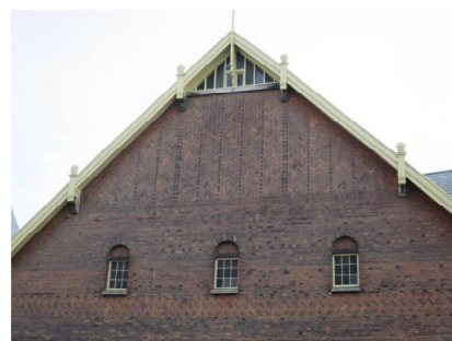
Eksempel på mønstermuring og detaljeret vindskede i pakhusets gavle.

I toldkammerbygningens indre knytter den kulturhistoriske værdi sig til den videre fortælling om bygningens oprindelige funktion. Dette ses af den ældre grundplan med blandt andet stueetagens