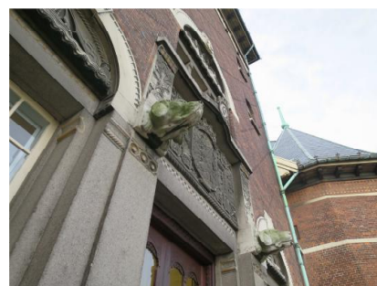
Indgangspartiet med sandstensblændinger og hundehoveder.