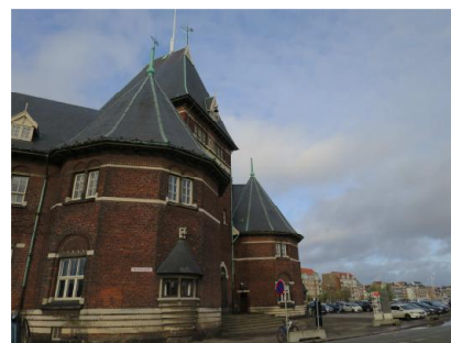
Sammenstillingen af midtertårnet og de to ottekantede hjørnetårne.

I midtertårnet findes et markant indgangsparti. Døren heri er en ældre, tofløjet, massiv teaktræsdør med bronzegreb og opdelt overvindue. Døren indrammes af granitindfatninger, ligesom de to vinduer på hver side af denne. Døren krones af en sandstenstavle, og herover ses et parti med tre små vinduer. Alle vinduer i