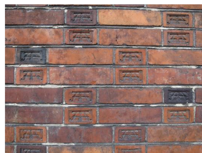
Eksempel på murværkets specialfremstillede "ATA-sten".

Bygningens overordnede symmetri, ensartede materialeholdning, vinduesrækker og gennemgående detaljer sørger for, at bygningen opfattes helstøbt og robust. Dette underbygges af den markante granitsokkel, der visuelt forhøjes med rækkerne af "ATA-sten" samt lysere sandsten. Hertil kommer værdien af de mange mønstermurede partier, der opbryder de ellers sammenhængende murflader og danner gavltrekanter og friser, samt fremhæver stik og blændingsfelter. Stenenes varierende brænding giver murene en levende stoflighed. I hele bygningen er materialernes variation og farver med til at fremhæve bygningsdele og -detaljer, hvilket resulterer i en elegant arkitektur. Facadens fremtrukne eller tilbageliggende partier skaber en dynamisk bygningskrop, og udtrykket forstærkes af reliefvirkningen fra dørenes og vinduernes placering i facaderne.