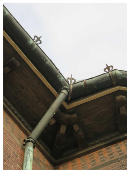
Gesimsen i træ samt kobber nedløbsrør og tagrender.