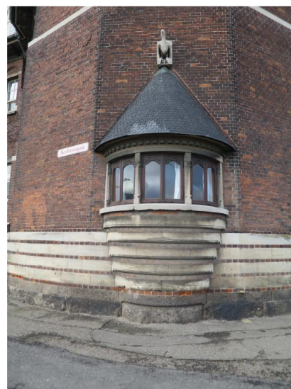
En af de to små karnapper på de ottekantede tårne.

Hertil kommer den brede trappe mellem de to hjørnetårne, der er med til at iscenesætte en formel ankomst til bygningen, mens det lukkede gårdrum har en mere anonym fremtræden og afspejler en mere praktisk anvendelse.