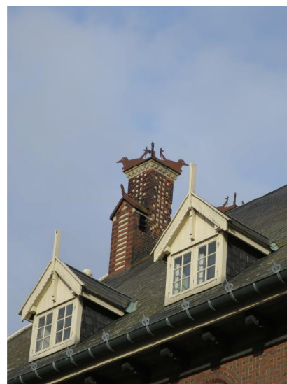
To af de små kviste med husbrande og en af skostenspiberne med mønstermuring og afslutning med fugle.

offentlige og repræsentative forhal, det store rum, som tidligere fungerede som vejerbod, og de oprindelige kontorer til regnskabsfolk og toldere. I de to hjørnetårne findes de fornemmeste kontorer oprindeligt til brug for havneopsynsmanden og toldinspektøren. Udsmykningerne i loftet henviser til bygningens nære kontakt til havet i form af de maritime motiver. Ydermere er strukturen på førstesalen bevaret med tjenestelejligheden samt den lange gang med nummererede, brede døre, som vidner om det oprindelige frilager, og på traditionel vis er bygningen forsynet med sekundære trapper med en sliske samt kælderrum og uudnyttede tagrum til opbevaring. Ydermere er det oprindelige urværk bevaret øverst i tårnet. I pakhuset påviser både de store, åbne pakhuslofter, den kraftige konstruktion med søjler, drager, bjælker og kopbånd samt de ældre elevatorer, at denne bygning har fungeret som lagerbygning.