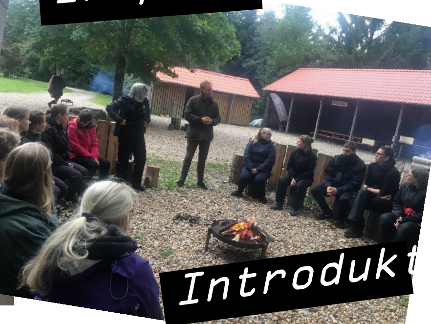
Eksterne oplæg Inspiration