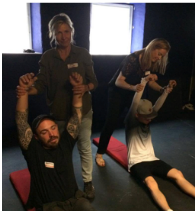
Gennem workshops blev pædagerne undervist i teaterpædagogiske greb