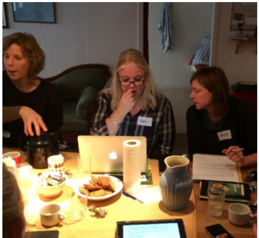
Workshops med teori om æstetisk læring og tid til at forberede æstetiske læringsrum