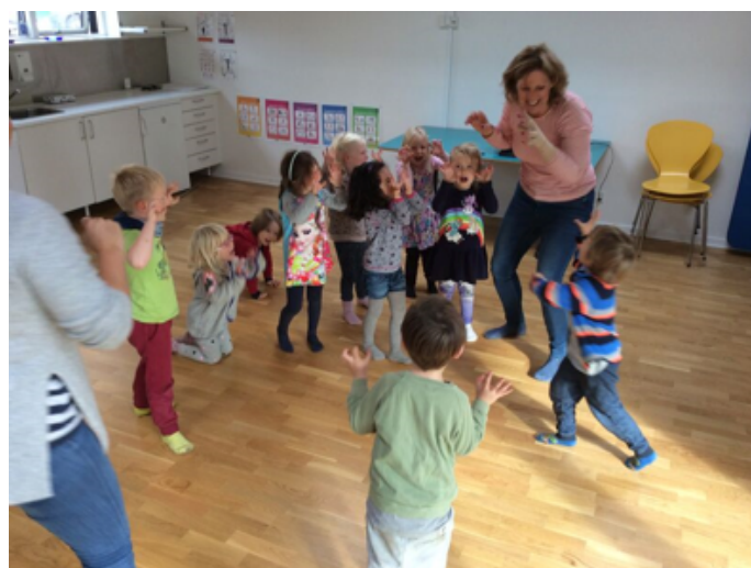
Fliorum's teaterpædagog krops- og sprogliggør teateroplevelsen og understøtter således børnenes forståelse af teateroplevelsen