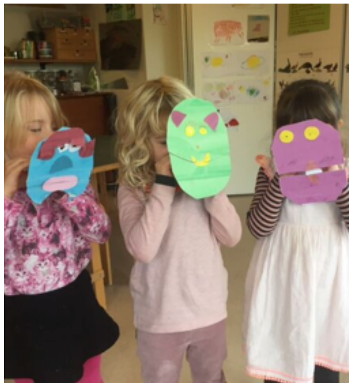
Første teaterbesøg på Marionet Teatret og første Kunstneriske Laboratorium udviklet af Fliorum, hvor indtryk bliver til udtryk