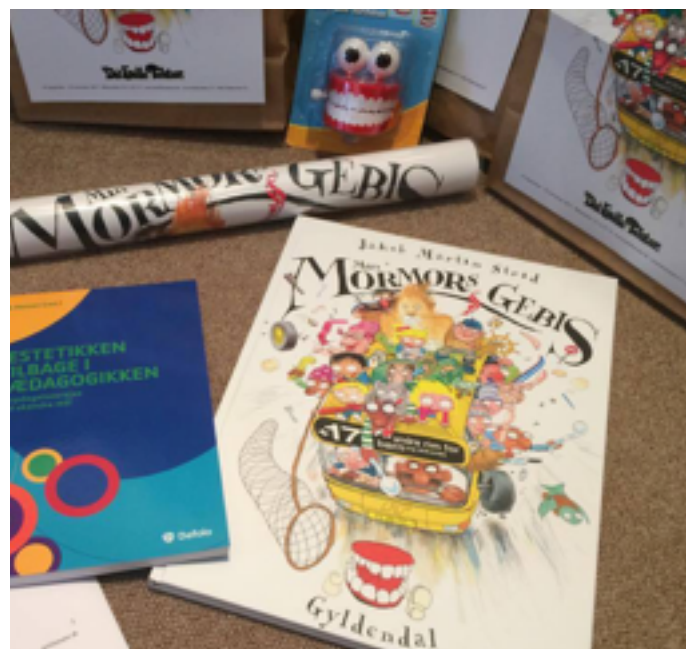
Semesterpakker til pædagoger og børn til forestillingerne "Min Mormors Gebis" og "Panama er alle tiders"