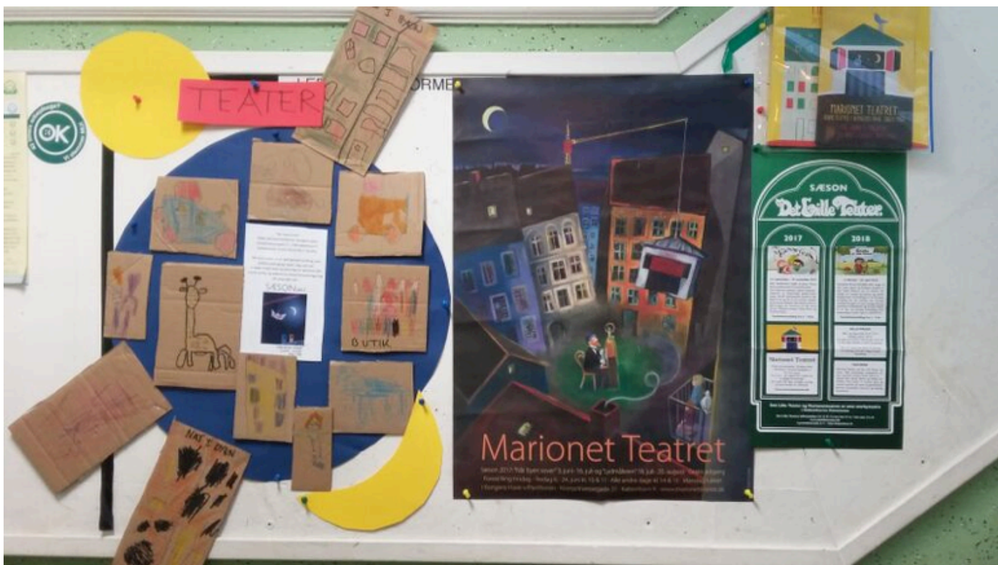
Aftryk af teaterprojekt i institutionen Land og By