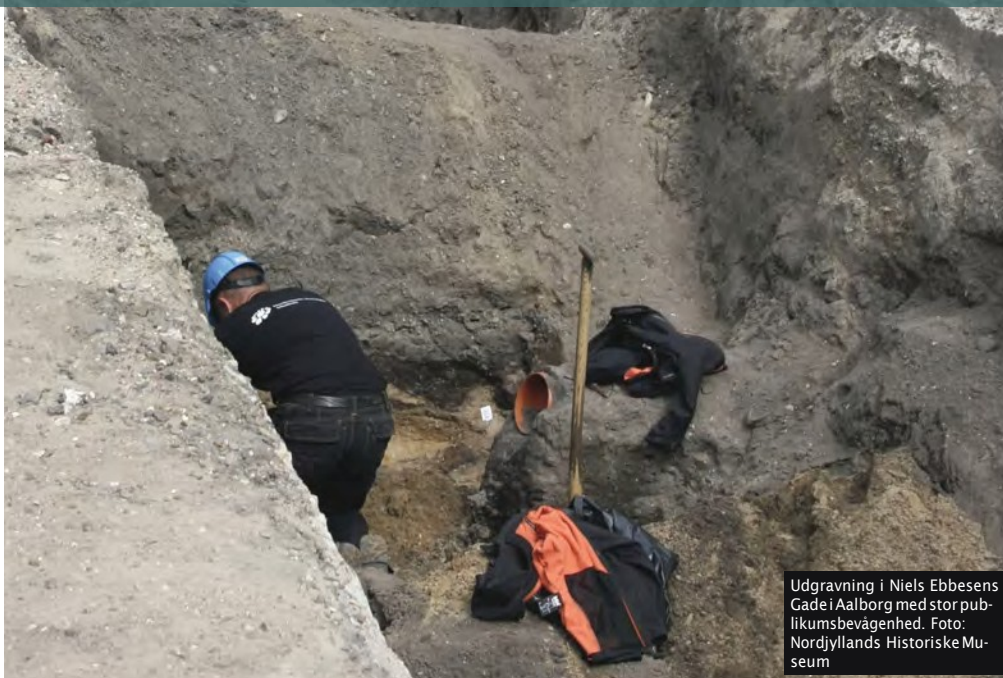
Udgravning i Niels Ebbesens Gade i Aalborg med stor publikumsbevågenhed.

Museerne kan hjælpe bygherre med at revurdere og omlægge anlægsprojektets dele, så man undgår at forstyrre fortidsminderne – og samtidig sparer på udgiften til de arkæologiske undersøgelser.