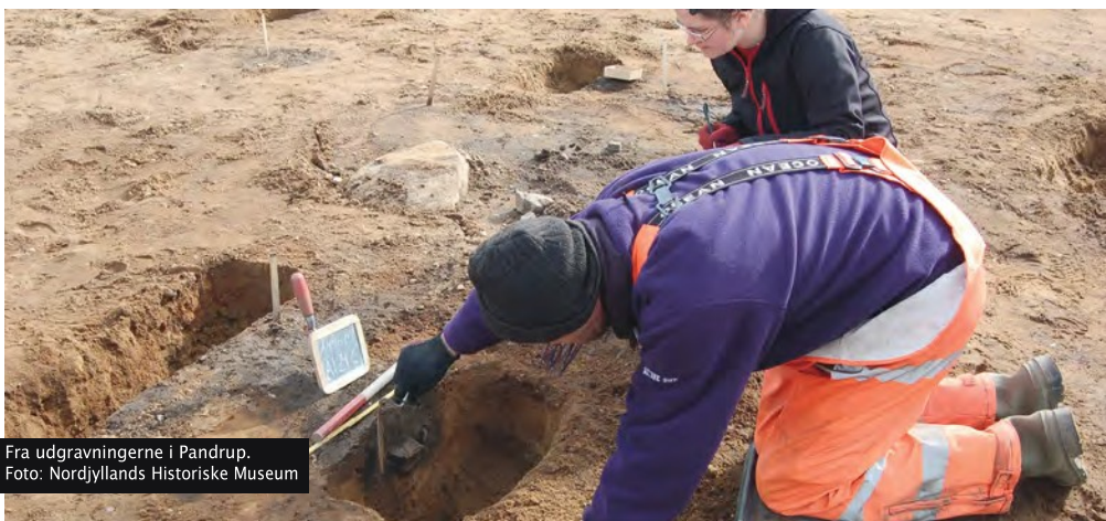
Fra udgravningerne i Pandrup.