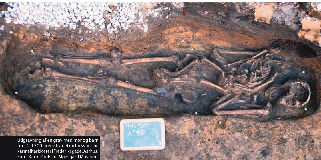
Udgravning af en grav med mor og barn fra 14–1500-årene fra det nu forsvundne karmeliterkloster i Frederiksgade, Aarhus.

I Danmark er arkæologien stort set den eneste kilde til vor viden om alt fra de ældste jægere, der kom hertil for ca. 14.000 år siden, og frem til vikingetidens bønder og krigere omkring år 1000 e.Kr. Herefter kommer de skriftlige kilder til hjælp og går hånd i hånd med arkæologien, når historien om middelalderen, renæssancen og den nyere tid skal fortælles.