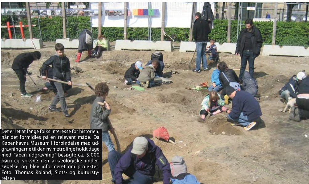
Det er let at fange folks interesse for historien, når det formidles på en relevant måde. Da Københavns Museum i forbindelse med udgravningerne til den ny metrolinje holdt dage med "åben udgravning" besøgte ca. 5.000 børn og voksne den arkæologiske undersøgelse og blev informeret om projektet.

I det følgende beskriver vi et par eksempler på virksom formidling i forbindelse med et byggeri.