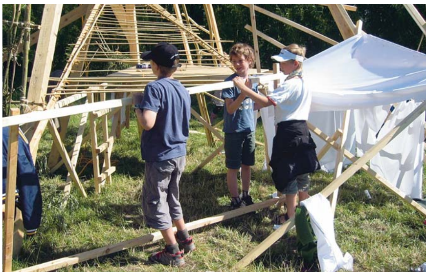
Bygamok2. Modelkommuneforsøg i Århus Kommune.

Ligesom BØRN RUM FORM og børnekulturportalen er konkrete bud på videndeling og synliggørelse, er BKN interesseret i, at alle fokusområder skal bidrage til børne- og ungekulturen i kommunerne og dermed understøtte visionen om Kultur for alle. BKN arbejder for, at alle børn og unge inkluderes i fællesskabet og møder kunst og kultur i deres hverdag. Derfor fyrrer BKN op under kedlerne og præsenterer inden længe en ny treårig strategi og en etårig handlingsplan.