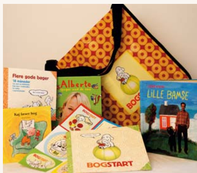
1 1/2 år