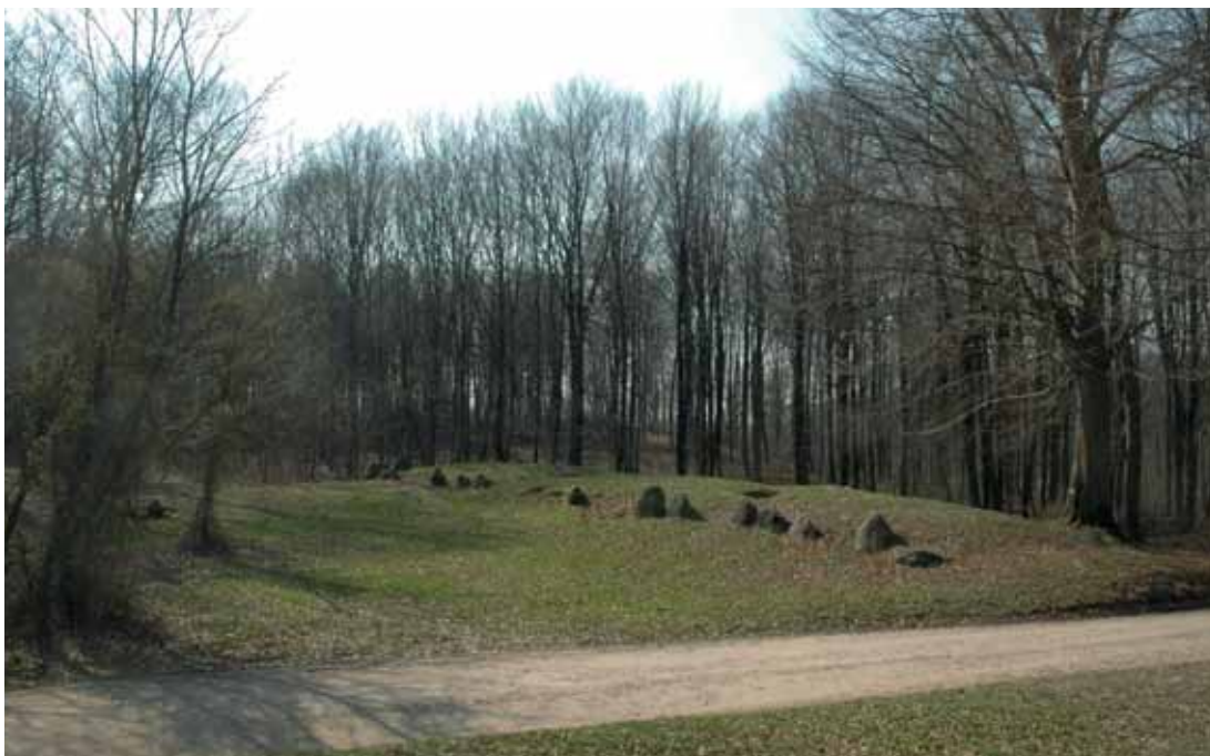
Fortidsminder i skov – langdysse friholdt for træer og opvækst.

iltfattigt miljø, hvor grave som Egtvedpigens kan bevares. Trærodderne kan også udgøre en mere direkte risiko i tilfælde af stormfald, hvor store kræfter er på spil. Dyssekamre er blevet ødelagt på denne måde – både ved at rødderne har trukket store sten op af jorden, og ved at en væltende stamme har ødelagt store dæksten. Derfor skal ikke-stormfaste træer fældes.