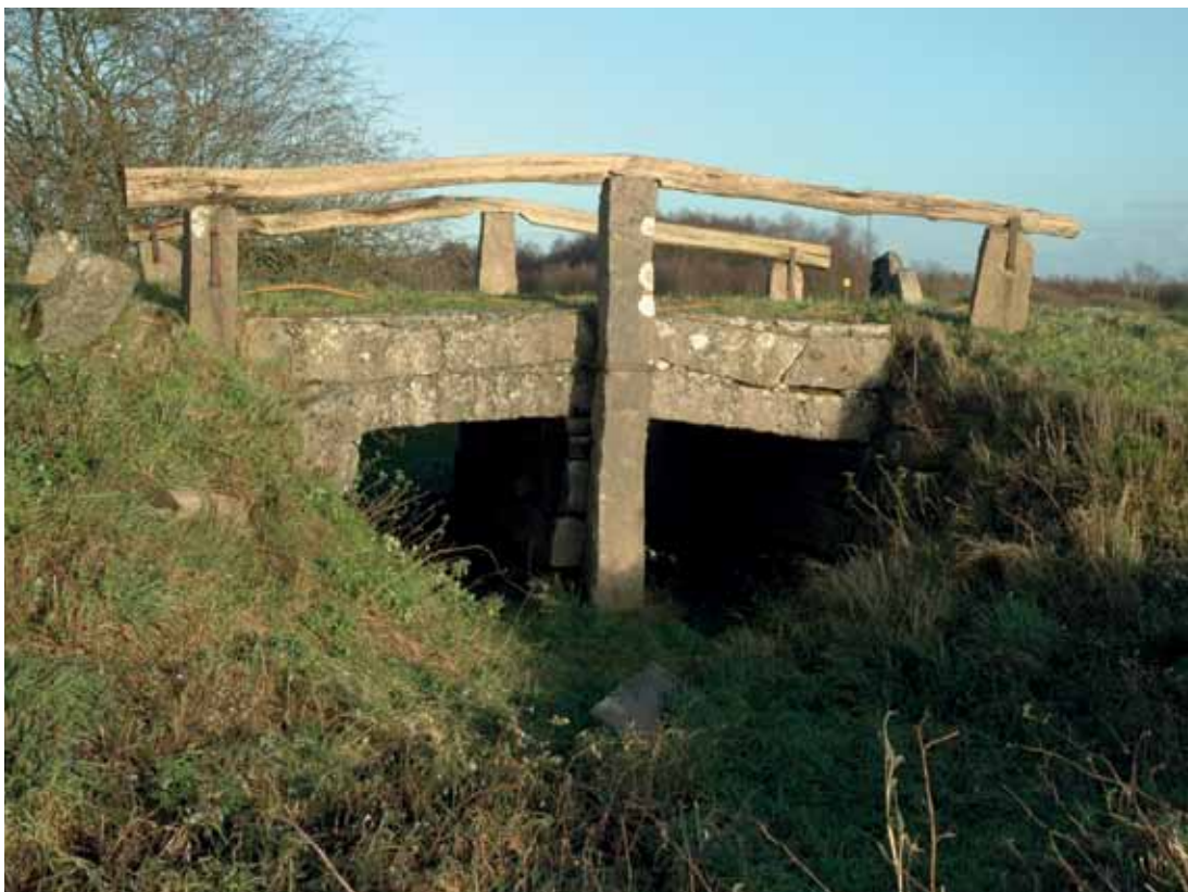
Der løber ikke længere vand under Immervad Bro, idet åen er ledt udenom. Broen er en del af hævejsforløbet i Sønderjylland.