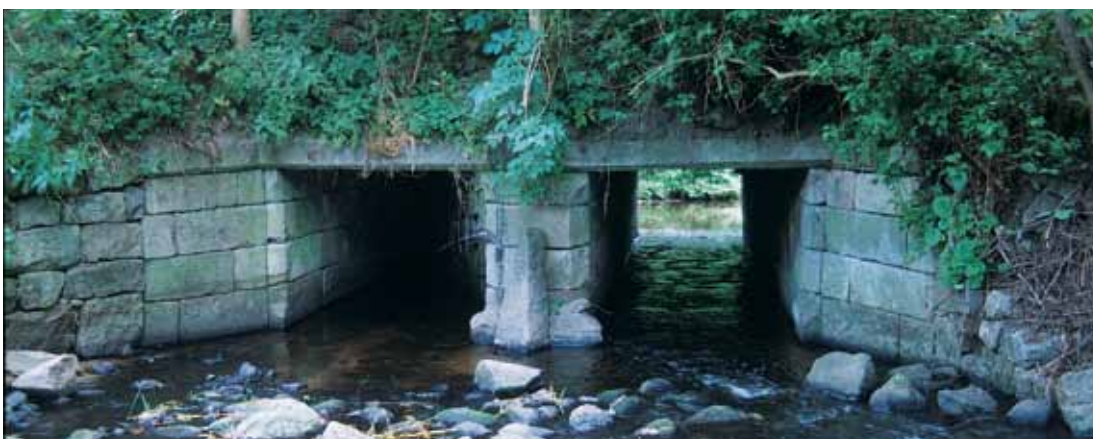
Under den fredede Boltinge Bro på Fyn løber der stadig vand.