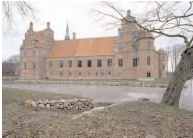
Vestfløj med hjørnepavilloner og porttårn