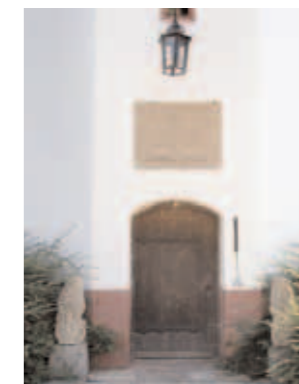
Rudbjerggårds haveside med voldgrav