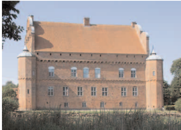
Vestside med renæssancegavle