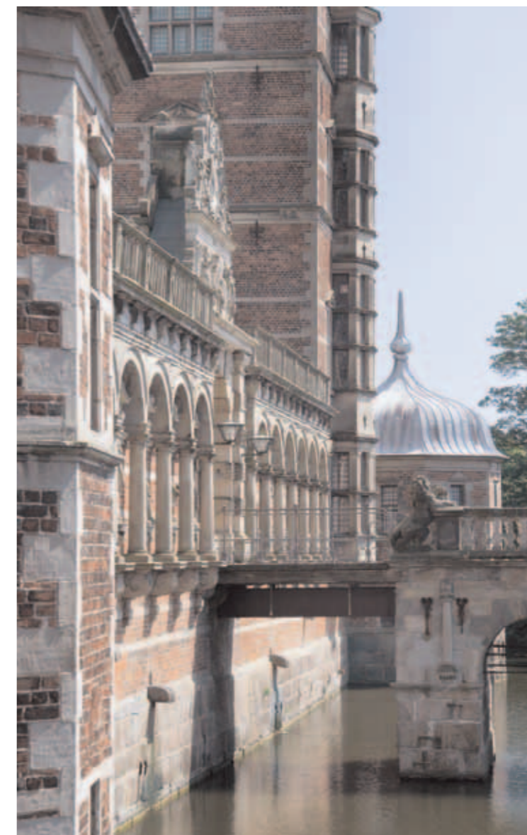
Frederiksborg Slot opfattes med sine festlige udsmykninger i sandsten som idealet af et bygningsværk i Christian 4.-stil