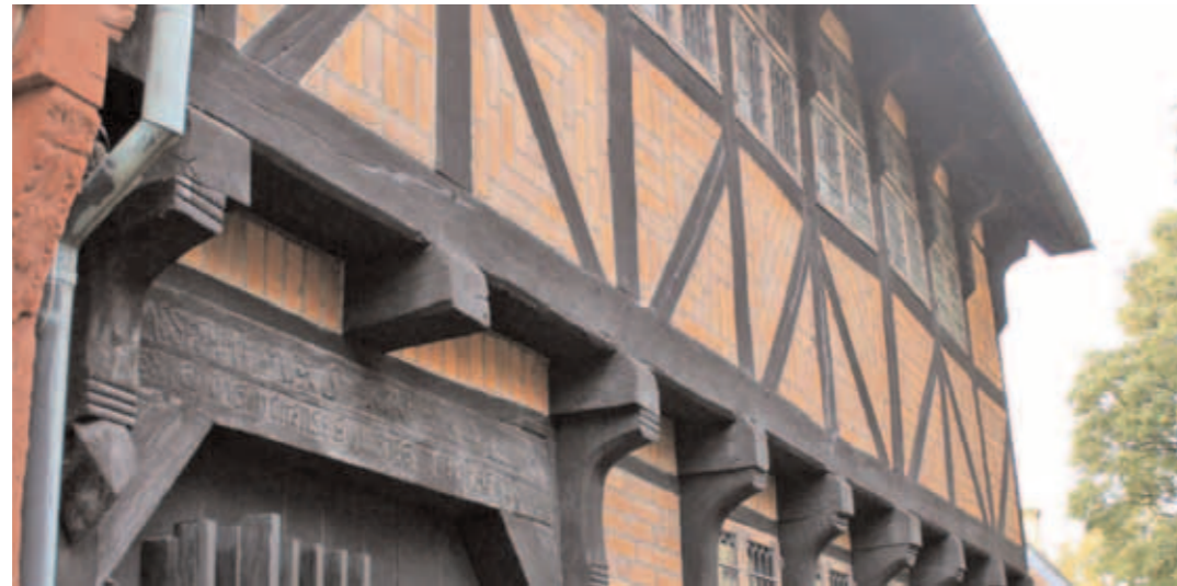
Eiler Rønnows Gård i Odense, opført 1547 af tømrer Mads Rab

Fra gammel tid har man bygget bindingsværkshuse i Danmark. Når man i 1500- og 1600tallet byggede i bindingsværk, var det som regel, fordi man ikke havde råd til at anvende det langt dyrere teglmateriale. Derfor overhvidtede man i ældre tid ofte bindingsværkshuse, så de kom til at ligne grundmurede bygninger.