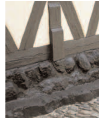
Bindingsværk med fodrem, skrånstivere og stolpe over sort-tjærede syldsten

Eiler Rønnow - bror til den sidste katolske biskop i København, Joachim Rønnow - var søn af rigsråd Marquard Rønnow til Hvidkilde, en besiddelse han overtog som mindreårig. Fra 1542 var han lensmand på Næsbyhoved og Skt. Hans Kloster i Odense, hvilket formentlig