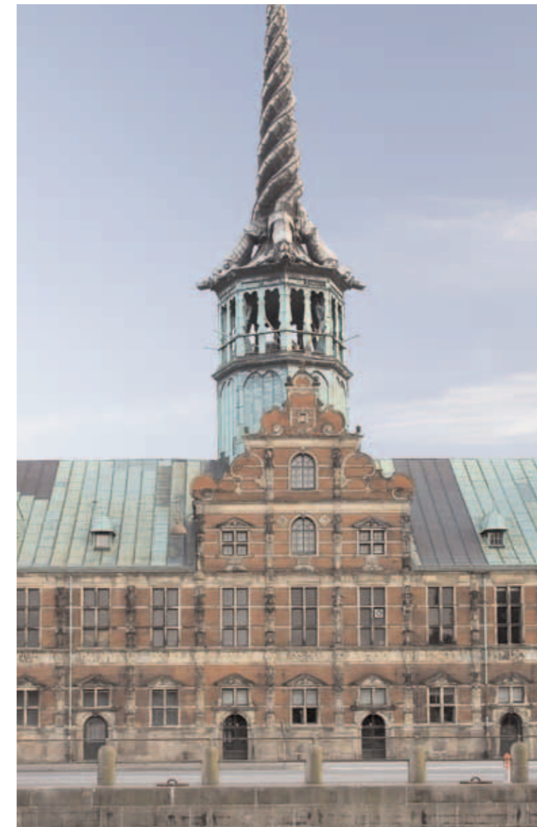
Mikkell Vibes Gård på Christianshavn, et af hovedstadens få bevarede renæssancehuse