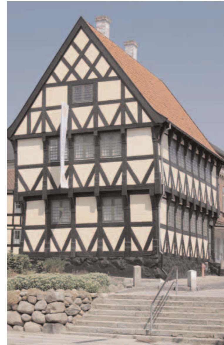
Anne Hvides Gård i Svendborg, opført i 1560'erne