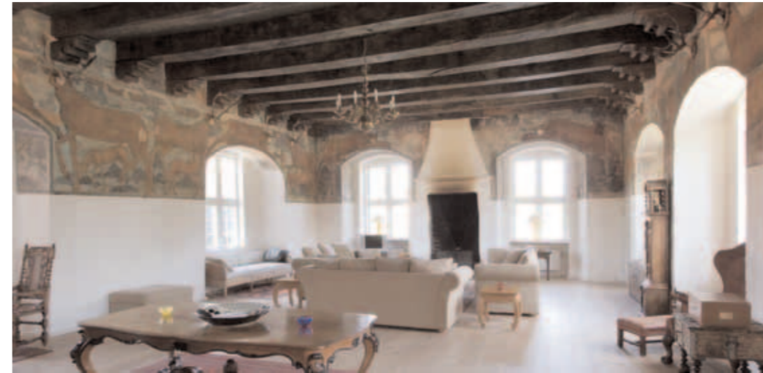
Hjortesalen på Hesselagergård, et tidligt eksempel på raffineret boligindretning i renæssancen

Hovedbygningen var således i bogstaveligste forstand en fæstning; man må erindre sig, at det ikke var længe siden, at landets bønder havde hærgnet og plyndret, så adelen beskyttede sig efter bedste evne, når den byggede. Forklaringen havde dog passet bedre i 1538 end her i 1550, hvor risikoen for overfald var minimal. Til gengæld må man ikke underkende den symbolværdi, der for adelen lå i at bygge borge, der lignede forter og var vandomflydte. Bygningstypen med enkeltfløjen med sine to hjørnetårne på ydersiden og et større adgangstårn mod avlsgården er med sine fynske og sjællandske efterfølgere blevet kategoriseret under begrebet herreborge. Dem skal vi siden