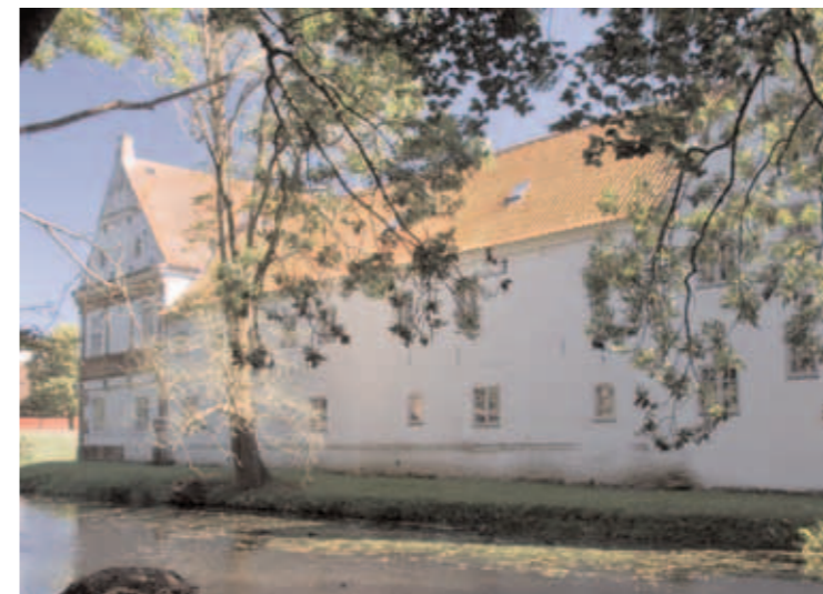
Brejningggård fra nord