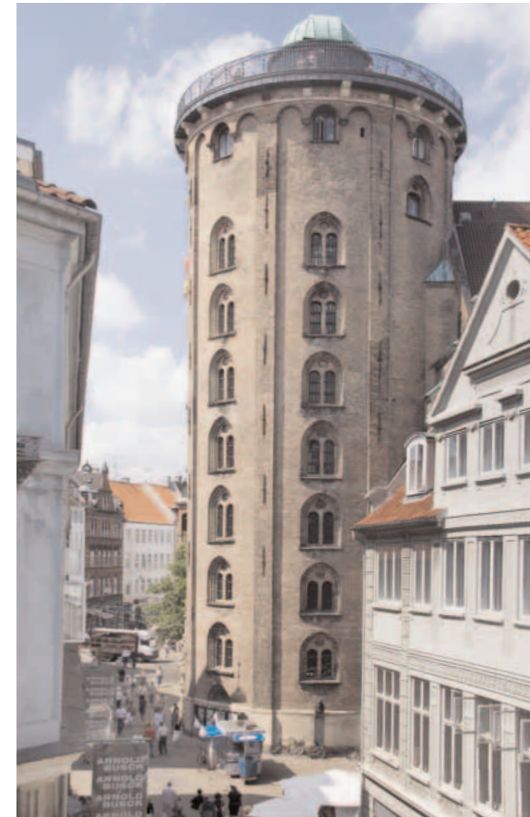
Trinitatis Kirke fuldførtes først i 1656 under Frederik 3. Hvælv og detalje af stovværk