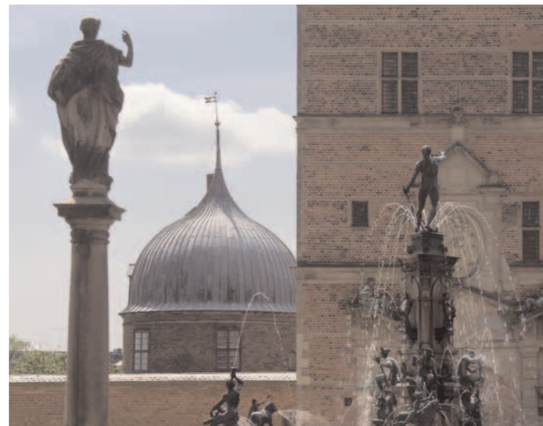
Christian 4.s Frederiksborg Slot med springvand og porttårn. I baggrunden en af rondellerne fra Frederik 2.s tid

I 1500tallet fyldte kirken meget i den almindelige danskers liv. Men det blev ikke inden for kirken, som man ellers kunne have forventet, at det nye i arkitekturen først kom til at manifestere sig. Naturligvis blev der rokeret meget om på datidens kirkerum, så de kunne tilgode den nye lære, hvor den forkyndende præst og menigheden kom i centrum, og faste kirkestole for første gang vandt indpas. Mange af de katolske sidealtre med deres helgentilbedelser blev også udrangeret.