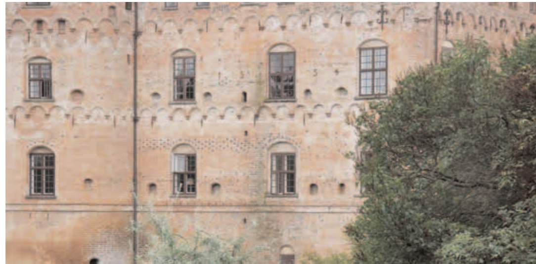
Murværk på Egeskov

Egeskovs hovedbygning gør ikke mindst indtryk, fordi den med sin imponerende størrelse dominerer sit omgivende landskab. Den er ganske enkelt blevet indbegrebet af en dansk renæssanceherregård, ikke mindst takket være sine voluminøse hjørnetårne med deres kobberspir og gavlenes svimlende høje kamtakker. Desværre må man ikke lade sig blænde for meget af disse, for de er faktisk skabt i 1883-84 af den svenske restaureringsarkitekt Helgo Zettervall i en tid, hvor fantasien ofte fik lidt for frit løb, når man 'førte en bygning tilbage til dens sande stil'. Hjørnetårnene var oprindeligt væsentligt lavere med spåntækte hætter, og i det mindste havde de to sydgavle et udseende nogenlunde som dem, der endnu findes på