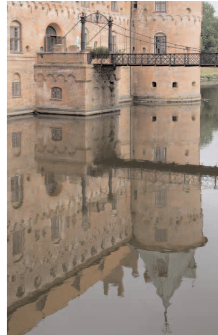
Indgangsportal på Egeskov med senere byggetavle