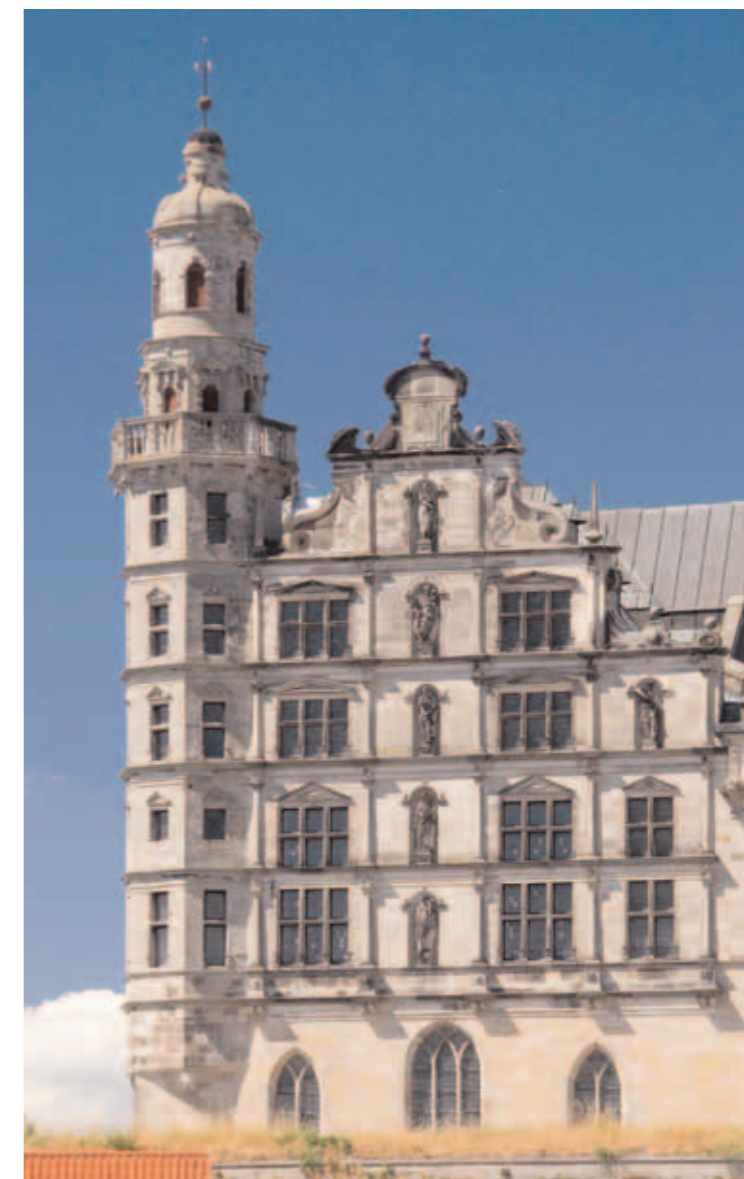
Portalen i slotsgården, der fører til Kronborgs kirke