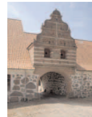
Horneporten på den fynske herregård Hvedholm er en af de få bevarede avlsbygninger fra renæssancen