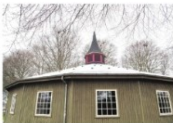
Der er debatmøde om folkeafstemningen om forsvarsforbeholdet i Den Runde Pavillon.

Debatmøde finder sted mandag 23. maj kl. 17 i Den Runde Pavillon i Brønderslev.