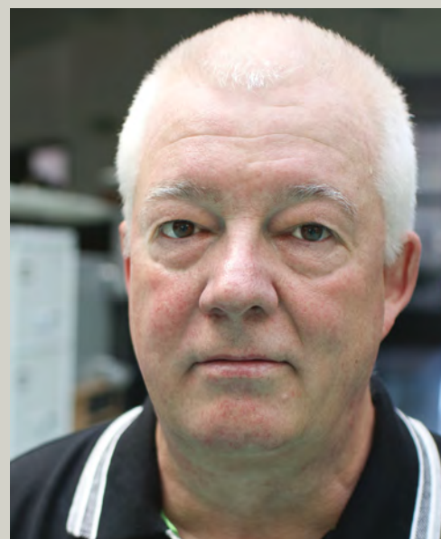
Marcus Schmidt (næstformand) indstillet af Dansk Folkeparti

Folketingsmedlem for Socialdemokratiet fra 1990 til 2011. Formand for Europaudvalget 2009-2011. Formand for Europa-Nævnet fra 2012.