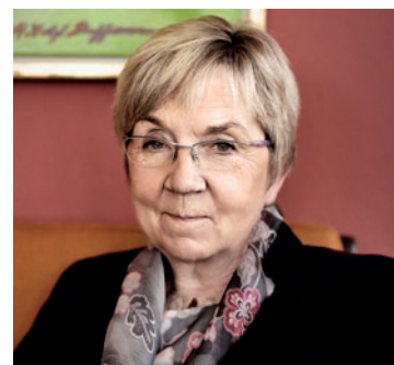
Marianne Jelved Kulturminister

Fælles viden – fælles handling, KL, Danmarks Lærerforening, BUPL, Børne- og Kulturchef- foreningen, Skolelederne, Skole og Samfund 2009