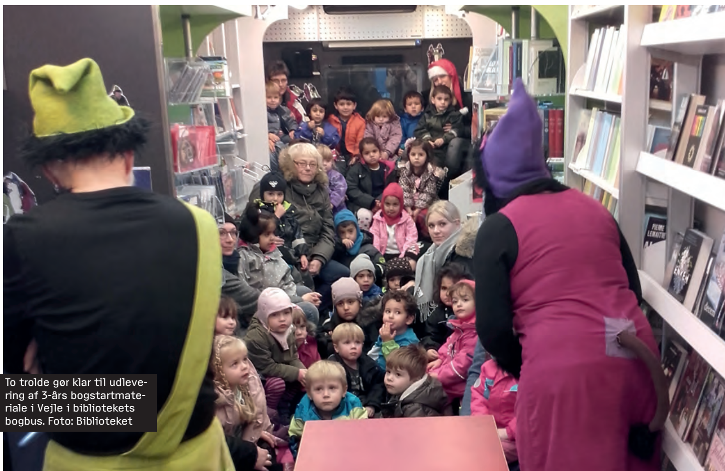
To trolde gør klar til udlevering af 3-års bogstartmateriale i Vejle i bibliotekets bogbus.