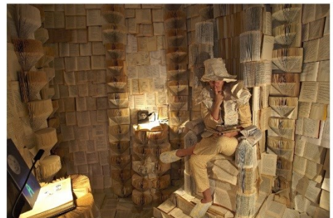
Forsideillustration fra BOGLABYRINTEN i Viborg