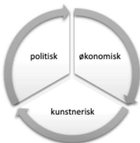
Figur 1: Bæredygtighed i Copenhagen Phil forstås indenfor de økonomiske, kunstneriske og politiske områder, hvor alle tre områder afhænger af hinanden.

Denne mission skal forstås inden for rammen, som omhandler økonomisk ansvarlighed, kunstnerisk integritet og og samfundsmæssig relevans: