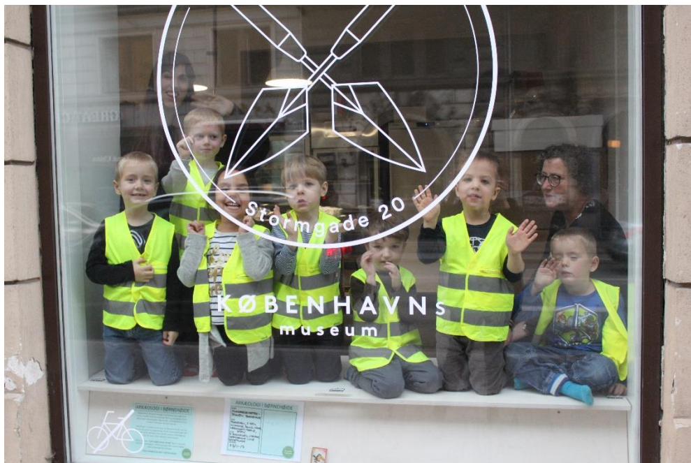
For gamle dage siden i drift i det nye Arkæologisk Værksted, Foto: Københavns Museum 2018

Museet tilbød i efteråret 2017 gratis forløb til alle institutioner. Hermed kom projektet til gavn for endnu flere børn. I samarbejde med Københavns Kommunes Åben Dagtilbud tilbyder museet nu gratis forløb om arkæologi til kommunens daginstitutioner. Læs om tilbuddet her: https://www.skoletjenesten.dk/tilbud/gamle-dage-siden-arkaeologi-i-bornehaven .