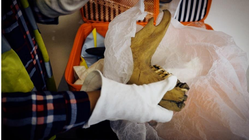
En arkæologikuffert pakkes ud. Foto: Julie Blicher Trojaborg, 2017

De studerende skulle undervejs i projektet aflevere to mindre rapporter til deres samlede studieportefolio. Den første skulle rumme en analyse af et museum, et spor eller en montre i dagtilbudspædagogisk perspektiv mens den afsluttende rapport skulle beskrive og analysere den pædagogiske aktivitet om arkæologi, som de studerende selvstændigt udviklede og gennemførte i deres praktikperiode.