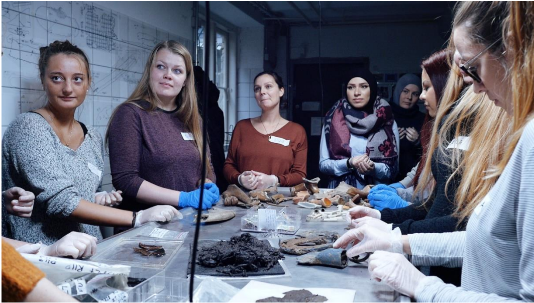
Pædagogstuderende til undervisning på Københavns Museum.