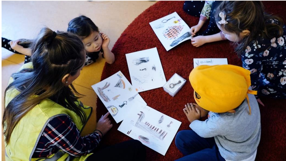
Pædagogstuderende laver pædagogiske aktiviteter i om arkæologi i en børnehave.