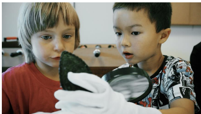
Hvem har haft skoen på? Arkæologi i børnehaven.

Projektet For gamle dage siden. Fremtidens pædagoger som vejvisere til Danmarks Historie blev udviklet og gennemført i et samarbejde mellem Københavns Museum og Pædagoguddannelsen på Professionshøjskolen UCC i perioden september 2016-december 2017.